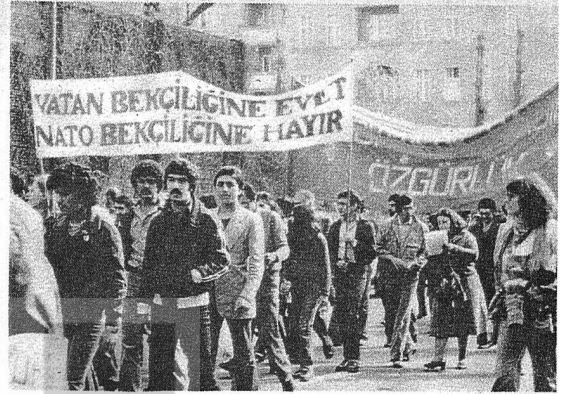
GENÇLERİMİZ DÖVİZLİ ASKERLİK YASASINI ŞİDDETLE PROTOSTO EDİYORLAR

...FİDEF, tekellere, silaha, NATO'ya döviz sağlanmasına, Türkiyeli işçilerin döviz makinesi olarak görülmesine karşında Tek bir fenik bile olsa, ama belli saldırgan NATO'ya, işkenceci askerî cuntaya para gönderilmeli, zor durumda olmayan gençlerimiz bedel ödemeye başlamamalıdır."