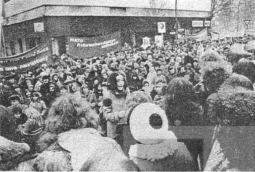
BATİBERLİN'DEKİ ANMA TÖRENİ

Barış savaşını öğretileri güncelliğini koruyor