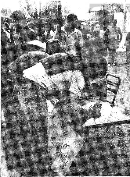
YUNANISTAN'DA CUNTAYA KARŞI İMZA KAMPANYASI SÜRÜYÜR