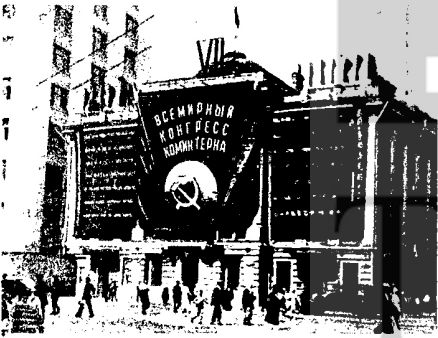
KOMÜNİST ENTERNASYONAL'IN 7. KONGRESİ'NİN MOSKOVA'DA TOPLANDIĞI BİNA.

25 Temmuz-20 Ağustos 1935 tarihleri arasında Moskova'da yapılan Komintern 7. Kongresi, dünya komünist hareketinin savaş tarihinde unutulmaz bir dönüm noktası oldu. Georgi Dimitroff'un başını çektiği Komintern, faşizmin sınıfsal analizini yaptı, bundan çıkarak anti-faşist savaşın çeşitli yönlerini değerlendirdi, görevleri saptadı. Bir çok komünist partisinde etkin olan "sol" sekte görüşlere son verildi. Sağ ve "sol" oportünizm düşmeden anti-faşist güçlerin birliği için savaşın, barış için savaşın baş görev olduğu ilan edildi.