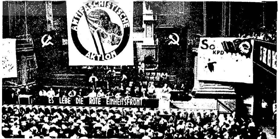
10 TEMMUZ 1932'DE BERLİN'DE TOPLANAN ANTI-FAŞİST BİRLİK KONGRESİ'NİN EN BAŞ BELGİSİ, "ANTI-FAŞİST EYLEM" KAMPANYASININ GENİŞLETİLMESİYDİ.

KPD, 1932 yazında keskinleşen kriz ve sınıf savaşı koşullarında anti-faşist güçlerin birliği savaşına hız verdi. 24 Mayıs 1932 toplantısında, Thälmann, MK'ne Almanya'yı saracak olan bir "Anti-faşist Eylem" kampanyası önerdi. Bu öneri kabul edildi. Bu kampanyayla milyonlarca emekçi somut istemleri çerçevesinde derlenecek, bu savaş anti-faşist savaşa bağlanacak, faşist terör yığınlarını kendini koruma birlikleriyle kırılacak, faşizmin yolu keşilecekti. Bu kampanya için MK'ne bağlı özel bir komisyon kuruldu. Anti-faşist Eylem, gerçekten de tüm Almanya'da faşistlerin beline inen ağır bir darbe oldu. Anti-faşist Eylem, sosyal demokrat işçiler arasında da geniş destek buldu. Bir çok şehirde, fabrikada sosyal demokrat fonksiyonerler sendikacılar, komünistlerle birlikte savaşıyorlardı. Thälmann, açıklamalarında sosyal demokratların Anti-faşist Eylem'e katılmak için örgütlerinden ayrılmalarının zorunlu olmadığını ilan ediyor, eski sekter görüşleri (önceleri birlik cephesi dence, sosyal demokratların örgütlerinden ayrılıp KPD'ye gelmesi anlaşılıyordu) yere çalıyordu. KPD, burjuva çevrelerin bile anti-faşist birlik cephesine çekilebileceğini görüyor, eski yanlışlarını hızla düzel-