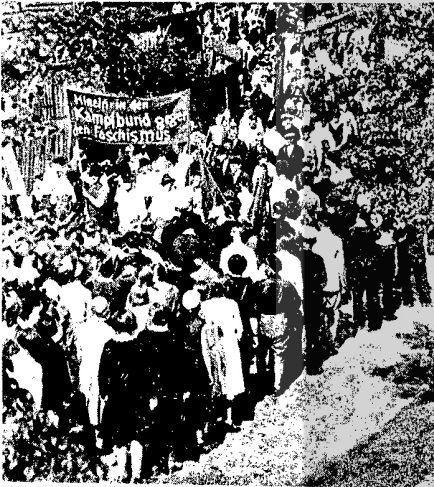
1931 YILINDA, TARIM İŞÇİLERİNİN KPD'NİN ÖNCÜLÜĞÜNDE YAPTIĞI BİR YÜRÜYÜŞTEN.

Bu arada SPD yönetiminin de desteğiyle azgın gerici Hindenburg cumhurbaşkanı seçilmişti. Hindenburg gittikçe daha gerici hükümetleri halka dayattı. Bu saldırı içinde faşistlerin desteğiyle Prusya koalisyon hükümeti de 20 Temmuz 1932 'de bir darbe sonucu yıkıldı. Tüm güç Hitler'in yandaşı von Papen elinde derlendi. Thälmann tüm anti-faşist güçleri uyarıyor, yaklaşan korkunç tehlikeyi, yaklaşan faşist diktatör lüğü gösteriyor, anti-faşist savaşı güçlendirmeye çağırıyordu. Artan faşizm tehlikesine karşı Anti-faşist Eylem gittikçe daha geniş yığınları çekiyordu. Grev dalgası Almanya 'yı sarıyordu.