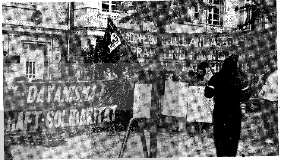
12 EYLÜL 1980 GÜNÜ DÜSSELDORF'DA TÜRKİYELİ VE ALMAN İLERİCİLER TÜRKİYE'DE Kİ NATO'CU GENERALLERİN DARBESİNİ KONSOLOSLUK ÖNÜNDE PROTESTO ETTİLER.

Yürüyüş sonunda CGT sorumlusu, yaptığı konuşmada özetle şöyle dedi "Emperyalizm ve işbirlikçi burjuva-