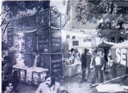
İŞÇİLERİMİZİN DEV STANDI BASIN ŞENLİĞİ'NE KATILAN YERLİ-YABANCI İŞÇİLER TARAFINDAN İLGİYLE İZLENDİ.

KURTULUŞ..... 15 Günlük İşçi Gazetesi Sahibi : TTO..... Sorumlusu..... TTO Yönetim Kurulu Adres (Anschri): KURTULUŞ.....Katzbach str.3-1 Berlin 61 Konto Numaramız : .....Türkische Sozialisten Gemeinschaft Postscheckamt Berlin-West 2 3 9 3 8 8 - 1 0 9 Maarafı : 50 Pf..... Yıllık Abone : 25 DM. Banka : ...Eigendruck /.....Katzbach str.3-1 Berlin 61