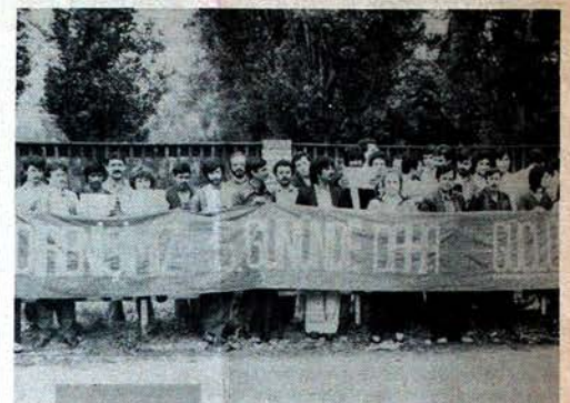
HA-WES İŞÇİLERİ ÇALIŞMA SENATÖRLÜĞÜ'NÜN ÖNÜNDE GÜRÜLÜYOR Baştarafı 1. sayfa