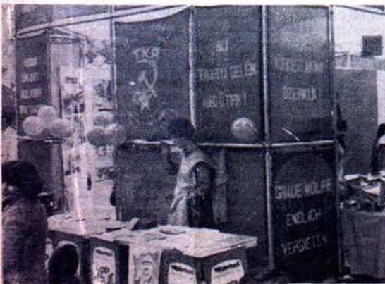
TKP'NİN 60. SAVAŞ YILIYLA İLGİLİ ÇIKARILAN ALMANCA BİLDİRİDEN BASIN ŞENLİĞİ'NDE BİNLERCE DAĞITILDI.