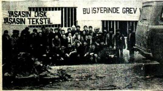
METAL, TEKSTİL VE CAM GREVCI İŞÇİLERİYLE YURTTA VE YURT DIŞINDA DAYANIŞMA YÜKSELİYOR.

Grevci işçiler ekmeklerini, çocuk çocuklarının gelecekleri