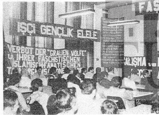
DTİG'İN GENEL KURULU'NA ÇOK SAYIDA ÜYE VE KONUK KATILDI

Düsseldorf Türkiye İşçi Gençlik Birliği'nin 3. Olağan Genel Kurulu 27 Mayıs'da Gewerkschaftshaus salonunda yapıldı. Çok sayıda üye ve konuk katıldığı Genel Kurul salonu "Faşizme Geçit Yok", "141-142'ye Hayır", "İşçi Gençlik Elele" "Çalışma ve Eğitim Hakkı İçin Heri" belgilli pankartlarla donatılmıştı. Dernek başkanının açılış konuşmasından sonra Alman Komünist Partisi (DKP) Mannesmann işyeri gurubu, FİDEF, Yunan Demişçi temsilcileri ve daha bir çok kuruluşun mesajları okundu.