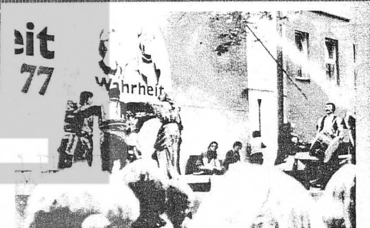
BU YIL DA BASIN ŞENLİĞİNE ARTIF OLARAK KATILUYORUZ.