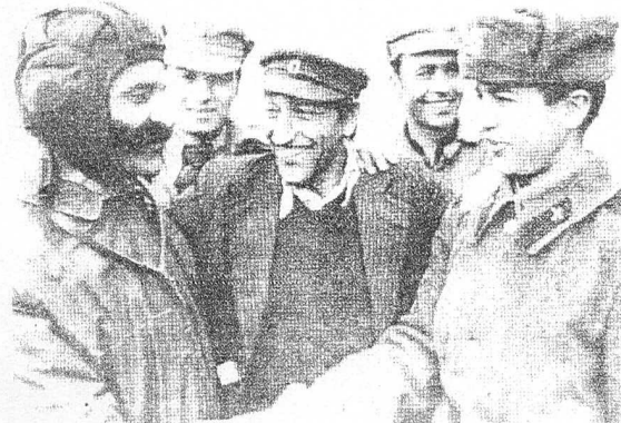
SOVYET VE AFGAN ASKERLER ARASINDA KARDEŞ BULUŞMA.

İslam ülkeleri Dışişleri Bakanları 11. Konferansı Pakistan'ın başkenti İslamabad'da yapıldı.