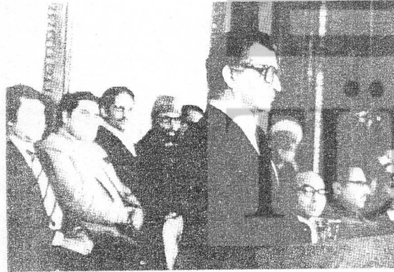
ADHC BAŞBANKANI VE ADHP GENEL SEKRETERİ BABRAK KARHAL BİR TOPLANTIDA GÖRÜLÜYOR.