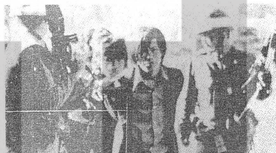
AMERİKAN EMPERYALİZMİNİN AYAKTA TUTTUĞU GERİCİ REJİM HER TÜRLÜ DEMOKRASİ İSTEMİNİ TERÖRLE BASTIRIYOR.