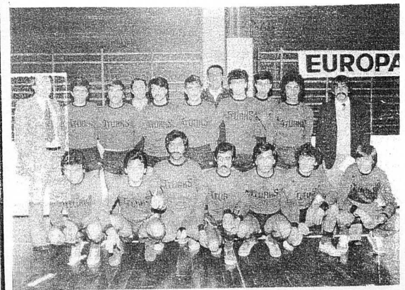
TİROL TÜRK SPOR KADROSU TOPLU HALDE

kumarcıların takım Türkgücü'nü 1-0 yenmeyi başardılar. Turnuvanın sonunda bir öğle yemeği pan Tirol Türkspor gönüllüce eğlendi.