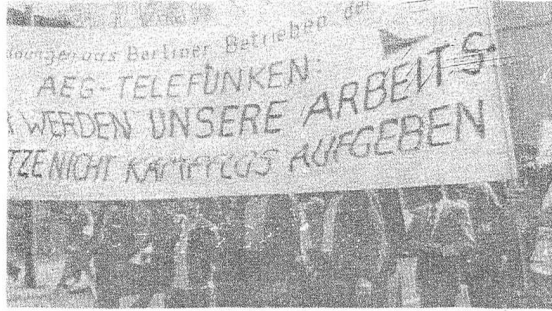
AEG İŞÇİLERİ 1 MAYIS'DA İŞTEN ATMALARA KARŞI YÜRÜDÜLER:

Ayrıca patronlar işçilerin yan ödemelerini de kaldırmayı planlıyorlar.Bu baskılara karşı Batıberlin Sickingenstr'deki AEG işçileri geçtiğimiz aylarda kasa süreli işi bırakma eylemi yaptılar,Binlerce imza toplayarak uygulamaları protesto ettiler,durumu ayrıca Bele-