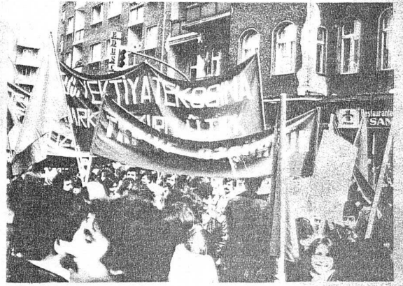
BATİBERLİN 1 MAYIS YÜRÜYÜŞÜNDE DEMOKRATİK İŞÇİ DERNEĞİ TÜRKÇE VE KURTCHE BELGİLERİNİ TAŞIDILAR.