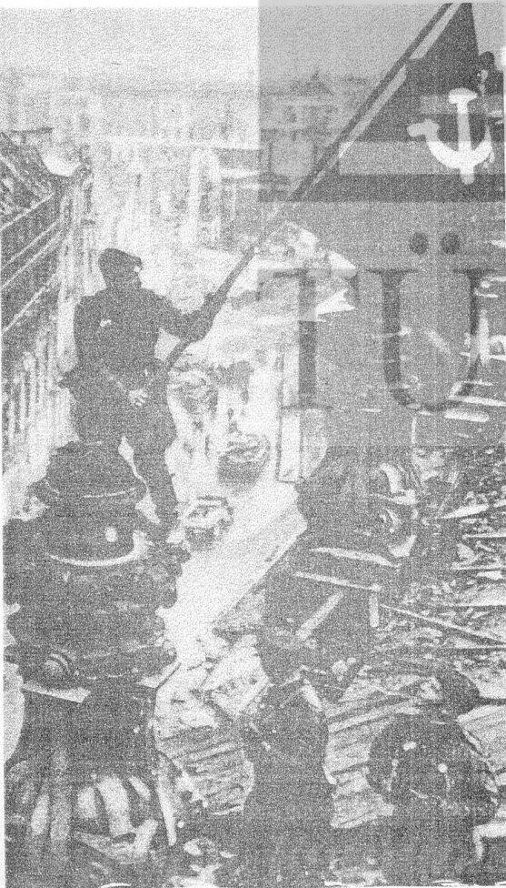
KAHRAMAN KIZIL ORDU ASKERLERİ BERLİN'İ KURTARDIKTAN SONRA