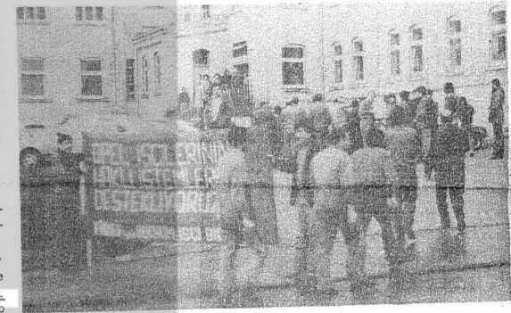
BOCHUM İŞÇİ BİRLİĞİ FABRİKA ÖNÜNDE BİLDİRİ DAĞITIRKEN

Gelsenkirchen Kadınlar Birliği, 22 Nisan günü, dünya işçi sınıfının büyük önderi V.I. Lenin'in 110. doğum gününü kutladı. Örgüt binasında bir seminer düzenledi. Çok sayıda işçimizin katılımıyla yapılan seminerde Lenin'in yaşamı, savaşını ve öğretilerini anlatıldı. Semineye katılanlar Türkiye'de grevde olan sınıf kardeşlerimizle dayanışma içinde olduklarını vurguladılar. Ayrıca ilericiler gençlerimizin yığinsel örgütü İGD yöneticilerinin tutuklanması ve işkence altında tutulmalarını şiddetle protesto ettiler.