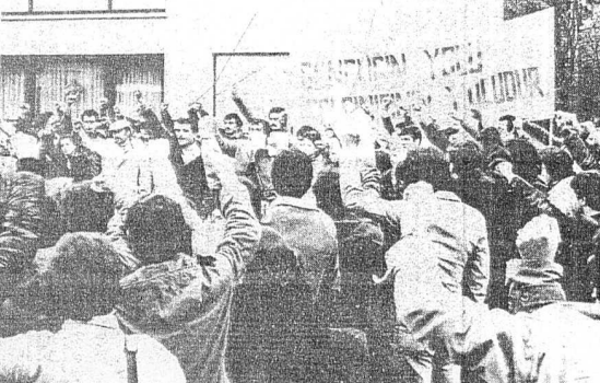
GENÇLİĞİMİZİN SAVASKAN ÖRGÜTÜ İGD'NİN KAPATILMASI, YÖNETİCİLERİNİN TUTUKLANMASI YURTTA VE YURT DIŞINDA SEKP PROTOSTOLARA NEDEN OLDU. RESİMDE FİDEF'İN PROTOSTO MITINGİ'NE GÖRÜLÜYOR.

Not: F. Almanya'nın 1 Mayıs yürüyüşü yapılan bölgelerinden şu ana kadar haber yazılamadık. Bizden, 1 Mayıs eylemlerinin tamamını bildiremiyoruz.