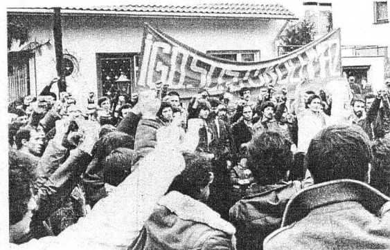
TUM F. ALMANYA'DAN BONN BÜYÜKELCİLİĞİ ÖNÜNE GELEN GENÇLİK TEMSİLCİLERİ, İGD'Lİ YÖNETİCİLERE YAPILAN İŞKENCELERİ LANİMLİDİ.

18 İGD yöneticisi 16 Nisan'dan bu yana sorgusuz gereksiz zindanlarda. Halkımızın bu yiğit evlatlarına işçi sınıfının gittiği yoldan yürüyorlar diye işkence yapıyor, en ağır hakaretler ediliyor. Sonlarının yaklaştığını bilen Amerikancı hükümet, ordunun başında NATO'cu militarist klik bu denli alçakça CIA yöntemleriyle yükselen devrimci hareketi durduracaklarını sanıyorlar.