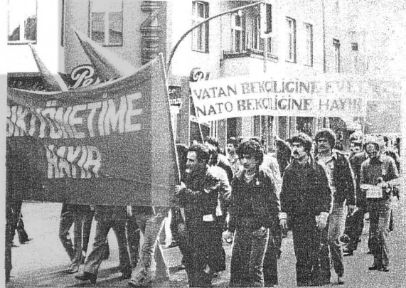
1 MAYIS'DA KALPLERİMİZ TUTUKLU KARDEŞLERİMİZLE BERABERDİR!

Recklinghausen'de bu yıl 23 Nisan Bayramı "İGD'li Abilerimiz Tutuklanamaz" belgisi altında yapıldı. Saat 12.30'da tüm gençler ve çocuklar Reck-