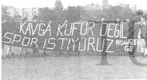
BOĞAZIÇI, SPORCU GENÇLERİN BİRLİĞİNDEN YANA!

Boğaziçilli gençlere gelince, onlara "Bravo" demek kalıyor. Bir yandan gençliğin düşmanlarına, reklamlara kan kustururken, diğer yandan da sistemli futbolcularıyla tüm kuzuları topluyorlar. Batıberlin'de son aylarda düzenlenen üç turnuvada da şampiyon oldular. Ardarda gelen bu şampiyonluklar seyirciler arasında şaşkınlık ve sevinç yaratıyor. Boğaziçilli gençler diğer takımların gençleriyle dostluk bağlarını sıkılaştırıyorlar. Sporcu gençlerin birliğinden korkan çıkarıcılar ise Boğaziçi'ni saf dışı bırakmak için ellerinden gelen herşeyi yapıyorlar. Batıberlin işçi sporcu gençliği günü gelende bunlara okkallı bir sille indirecektir.