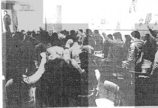
BATİBERLİN DEMOKRATİK İŞÇİ DERNEĞİ'NDE LENİN'İN 110. DOĞUM GÜNÜNÜ KUTLAYAN İŞÇİLERİMİZ ENTERNASYONAL MARŞ'I SÖYLERKEN.

FİDEF üyesi Bochum İşçi Birliği, Türkiyeli işçiler için bir dayanışma bildirisi çıkardı. Fabrika girişine işçilerimizle omuz omuza olduğunu açıklayan pankartlar astı.