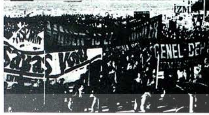
YURT DIŞINDAKİ İŞÇİLERİMİZ TÜRKİYE'DEKİ GREVÇİ İŞÇİ KARDEŞLERİNE HER TÜRLÜ DAYANIŞMAYI GÖSTERE CEKLERDİR.

ni yasallaştırın girişimler tezgahlanıyor. Sıkı-yönetimi generaller "iç savaş" çabıklarını atıyor ve "kan dökmekten" söz ediyor. Cumhurbaşkanı seçimi eşliğinde Anayasa değişikliği planlanıyor. Parlatonun simdiden daralan yetkileri tek adama toplanmak isteniyor. Yarı askersel zorbalık rejimi böylece yerleştiriliyor. Faşizm tehlikesi artıyor.