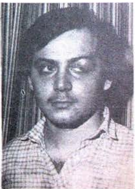
26 MART SALDIRISI