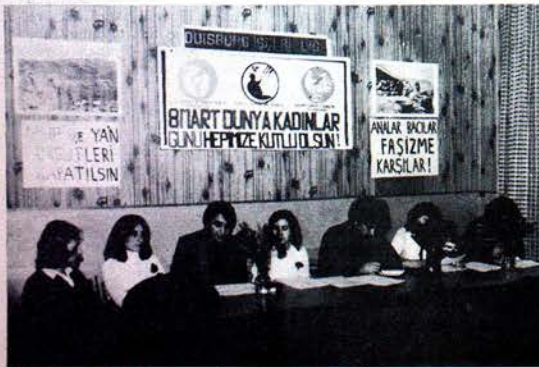
DUISBURG İŞÇİ BİRLİĞİ'NİN 8 MART TOPLANTISINDAN!