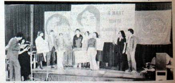
MÜNİH'TE 8 MART'TA DÜZENLENEN KÜLTÜR GECEBİ'NDEN.