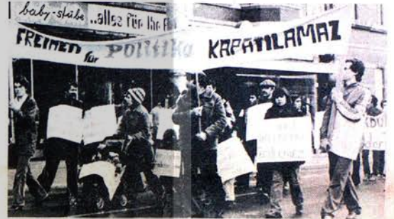
RECKLINGHAUSEN'DA YAPILAN YÜRÜYÜŞTE YÜZLERCE İŞÇİMİZ FAŞİST BASKILARI PROTİSTO ETTİ! "POLİTİKA SUSTURULAMAZ" DİYE HAYKIRDI

TKP, 17 Mart 1980 günü bir bildiri yayınlayarak halkımızı grevdeki işçilerle dayanışmaya çağırıyor. Bildirinin tümünü okurlarımıza 4. sayfamızda sunuyoruz.