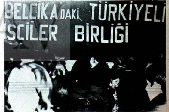
BELÇİKA'DAKİ TÜRKİYE'Lİ İŞÇİLER BİRLİĞİ'NDE 8 MART DÜNYA KADINLAR GÜNÜ DOLAYISIYLA DÜZENLENEN TOPLANTI YIGINSAL GEÇTİ.

Komünistler, bugün ilticacının devrimci bir gövzen olmadığını inanıyorlar. Devrimciliğin ölçülerinden birinin de bütün olanakları zorlayarak yurtta kalıp, yurtdışında savaşmak olduğunu vurguluyorlar. Yurtdışındaki devrimciler, komünistler, asıl savaş alanlarına, Türkiye'ye gitmeyi önelerine görev olarak koyuyorlar.