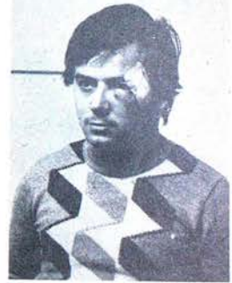
5 OCAK SALDIRISI

Yetkilileri uyarıyoruz. Bundan böyle, bir demokratın, bir ilericinin yaralanmasının veya öldürülmesinin tek sorumlusu yetkililerdir. Katil yuvaları dağıtılmadığı, elebağlarının sınır dışı edilmediği sürece, hiç bir demokratın can güvenliği yoktur. İkinci bir cinayete fırsat verilmemeli ve demokratların, ilerici işçilerin, ilerici gençlerin "Nim Faşist Örgütler Kapatılsın!" istemi yerine getirilmelidir.