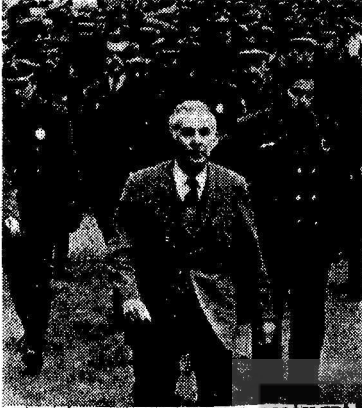
DİRENİŞE GEÇEN TOPLUM POLİSİLERİ! ÖLMEK VAR DÖNMEK YOK, DEDİLER

Türkiyemizde milyonlarca işçi ve emekçi, aldıkları düşük ücretler yüzünden sefaletin pençesinde kıvrılmakta, çocukları açlık ve hastalıklardan ölmektedirler. Bu işçi ve emekçiler, biraz daha iyi yaşayabilmek, ücretlerine bir kaç kuruş zam alabilmek için, işgaller, boykotlar yapıyorlar. Almanyalara işçi olarak gidiyorlar, bir lokma ekme parası kazanmak için, turist olarak memleketten kaçıyorlar.