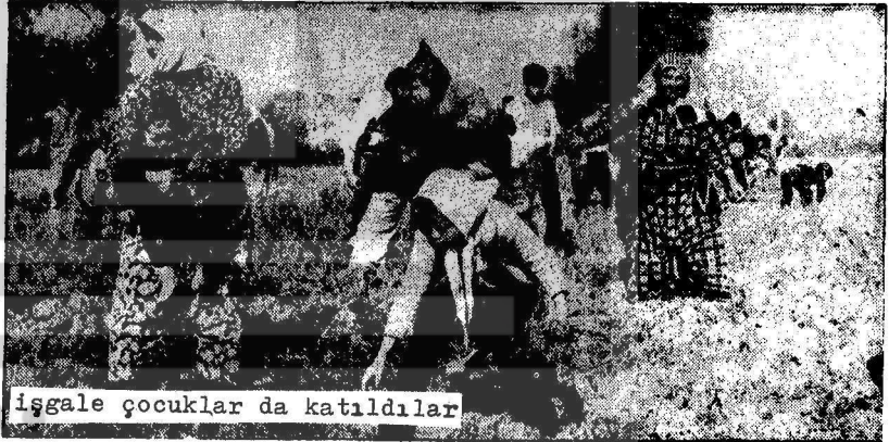
İşgale çocuklar da katıldılar

Arazinin Hazineye ait olduğu, fakat ağanın sahip çıktığı toprağı sürüp ektik