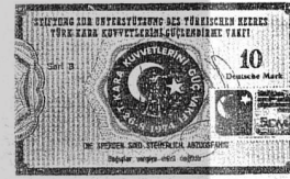
Vakfın sattığı pullar