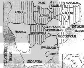
Afrika'nın güneyinde durum