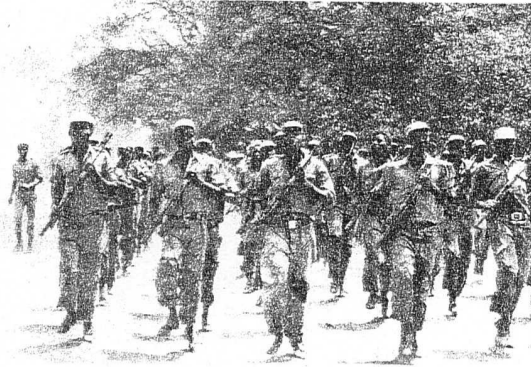
KURTULUŞ SAVAŞÇILARI HER DURUMA HAZIR .

Güney Rodezya'ya sınırları olan Angola, Zambiya, Mozambik, Botswana ve Tanzanya birleşerek cephe ülkelerle bağlaşıklığına kurduklar. Rodezya sınırlarını kapadılar. Bu ülkeler ulusal kurtuluş hareketini var gücüne destekliyorlar. Onun için ırkçı rejimin ordu birlikleri bu ülkelere sürekli saldırıyor, sivil halkı yığınsal olarak kat-