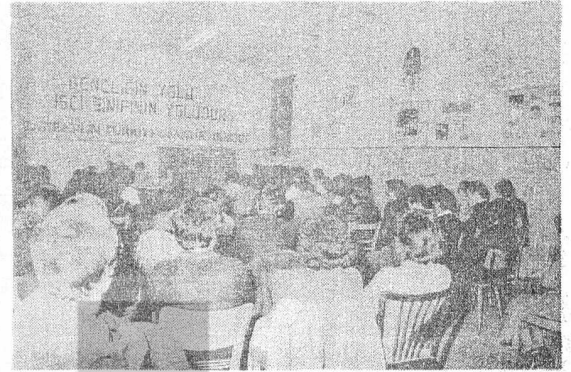
BATIBERLİN TÜRKİYE GENÇLİK BİRLİĞİ BATIBERLİN'DEKİ GENÇLERİNİZİN FAŞİSTLERE KARŞI BİRLİĞİ İÇİN SAVAŞIYOR!

Daha sonra faşizme karşı savaşın verildiği ve 40 bin Sovyet askerinin şehit düştüğü Treptower Park'taki şehitler anıtına gittik. Bu anıtın girişinde savaşta iki oğlunun kaybetmiş bir ananın heykeli var. Daha ileride ağlayan ananın şehit düşen iki oğlunun heykelleri karşılıklı bir şekilde, 40 bin Sovyet askerine saygı duruşunda bulunuyor ve yıllarında kızıllı mermerden Sovyet bayrakları duruyor. Bu kapıda girişten sonra geniş bir alanda sağ ve sol tarafta 16 tane, üzerinde Stalin'in sözleri bulunan bloklar var. Altından yazılmış olan bu yazılar, hep beraber okuyup tercümesini yaptık. Bir arkadaşımız Hitler faşizminin insanlık dışımlığını anlattı. Ağlayan Ana heykeli