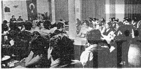
BATIBERLİN'DEKİ TOPLANTIYA 200'E YAKIN İŞÇİMİZ KATILDI

Darbecilerin yolunu açmaya çalışan hükümetin gerici baskılarını yılbaşında yüzlerce işçimiz Bonn'da protesto etti