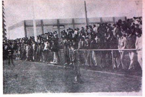
ŞAMPİYON BOĞAZIÇI'NIN TARAFKARLARI HEYECANLA MAÇI İZLERKEN.

Maç bağlamadan evvel Boğaziçililerin bildirimlerini spor kayafetleri ile dağıtmalarına rağmen, "Anadolu gazetesinin" bazı dernek üyelerinin" dağıttığı yalan bu gazetenin düzen-