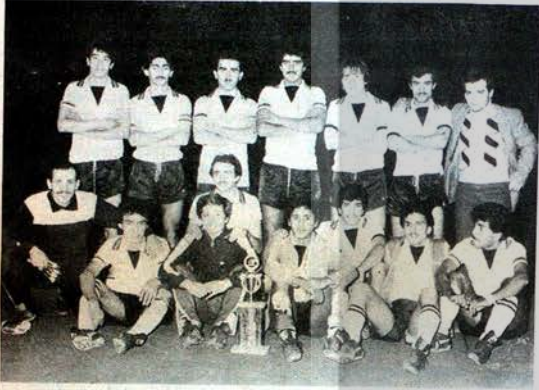
ŞAMPİYON BOĞAZIÇI TAKIMI TOPLU HALDE GÖRÜLÜYOR.

Gençler! Bunlar "politika yapmayı" der, politikanın daniskasını yapıyorlar. Kendi işlerine gelmeyen demokratik kulüplere karşı tavırları, Boğaziçi ve şimdiye kadar oynanan oyunların bunun ispatıdır. İşte Anadolu gazetesi gerçek yüzünü gösterdi. Kimden yana olduğunu öğrendik. Bunların oyunlarına karşı uyanık olmak, mücadele vermek, genç arkadaşlarımızı yarımcı olmak bizlerin görevidir.