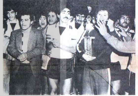
BOĞAZIÇI TAKIMININ OYUNCULARI ALDIKLARI KUPAYLA COŞKU İÇİNDE