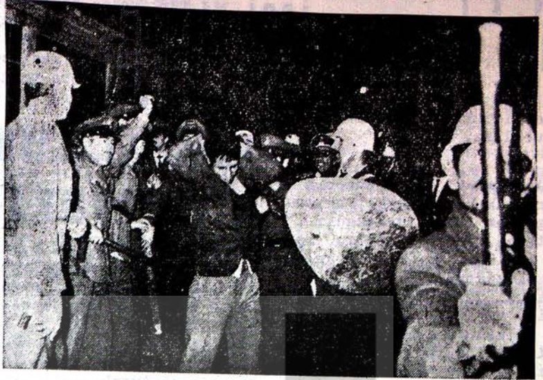
İŞÇİYE KALKAN ELLER KIRILACAKTIR

Bu direnişin sebebi, sendikacı işçilerin firma tarafından işten atılmalarıdır.