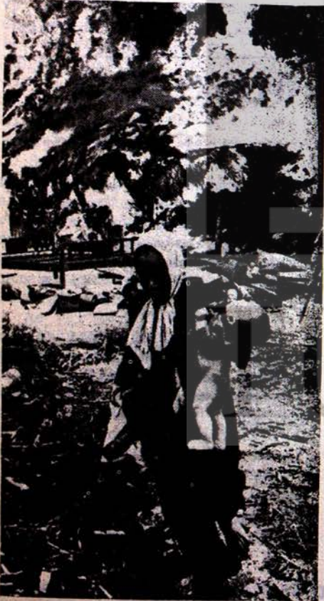
EZİLEN HALKLAR EMPERYALİZMI ER-GEÇ BOĞACAKTIR

Bütün bu paralar, ezilen halkların Milli Kurtuluş Mücadelesini yıkamayacaktır. Çünkü bu mücadeleyi, basta sosyalist devletler olmak üzere, bütün dünya emçileri desteklemektedir. Bağımsızlıklarını kazanan dünya ülkeleri, kapitalist olmayan yoldan, sağlam adımlarla sosyalizme doğru ilerlemektedir.