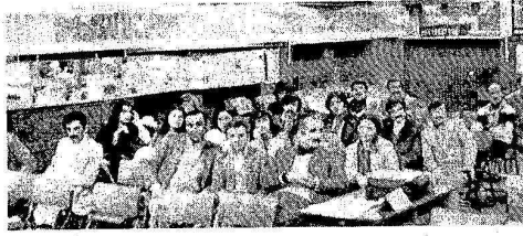
MAINZ TÜRKİYELİ İŞÇİLER DERNEĞİNİN 5. OLAN GENEL KURULUNA KATILAN İŞÇİLERİMİZDEN BİR KISMI GÖRÜLÜYOR !

Recklinghausen Türk İşçileri Derneği'nin yeni adresi: Marien Str.4 , 4350 Recklinghausen-584