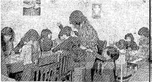
1979 YILI DÜNYA ÇOCUKLARI YILI OLARAK İLAN EDİLDİ. RHEINLAND-PFALZ'IN ÇOCUKLAR İÇİN DÜZENLEDİĞİ BİR AN GÖZÜLÜŞ TOR.

yönünde çalışmalar yapmış ve yer alıyor.Komite ayrıca, çeşitli girişimlerde bulunarak Türk çocukları için bir yer bulup, burada onların boş zamanlarını iyi bir şekilde değerlendirmelerine çalışacak.Burada onların Almanca derslerine yardımcı olacak, onlara kendi kültürlerini tanıttırma yolunda çalışmalar yapılacaktır.