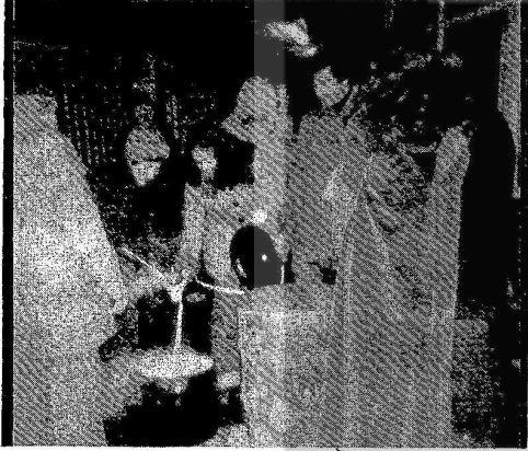
VARILIR ATAR LİZANDA ÇORBA. KREFELD THYSEN FABRİKASINDA KADIN-ERKEK İŞÇİLERİMİZ GREV SAVAŞINDA GÖRÜLÜYOR!

Krefeld'deki bayan okurumuza Savaş Köşe'sine gönderdiğiniz mektup ve fotoğraftan dolayı teşekkür ederiz. Diğer okurlarımız da gazetemize gönderdikleri haberlerle birlikte fotoğraf göndermelerinizi seviyoruz.