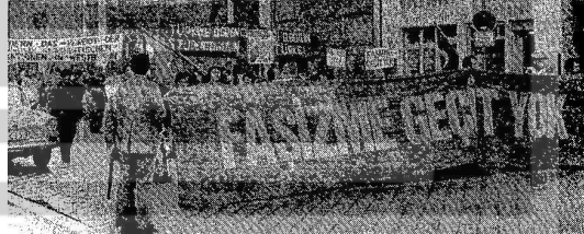
TÖB-B'İN "TÜRKÇE DEMEÇLERİ"NE BİR ÇOK ÖRGÜT KATILDI.

TÖB-B, gerek Üniversitede, gerekse Üniversite dışında -faşist,maocu akımlara karşı kararlı bir savaş yürütüyor.Yönetim Kurulu, son çıkardığı genel kurula çağrı bildirisinde, sosyalist, komünist, halkçı, Türkiye Kürt tüm ilericio, anti - faşist