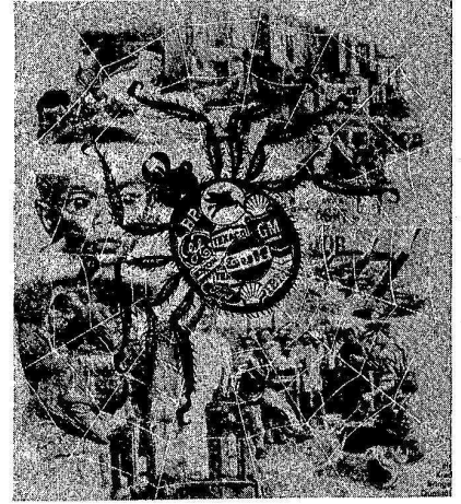
EMPERYALİST TEKELLER, BUNLARIN IMF GİBİ ÖRGÜTLERİ HALKLARIN KANINI EMERKE AYAKTA DURUYORLAR!

Bu çıkışlar, Türkiye Komünist Partisi Merkez Komitesi'nin 28 Aralık 1978 günlü çağrısında yer alan şu görüşün ne kadar doğru ve yerinde olduğunu gösteriyor: "Sıkıyönetimi dayatma planının içinde, İran'daki olaylardan sonra ölkemiz ö