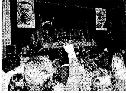
ÖNEBİLER ATILIN GECELERİNDE ANILDI