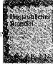
METALL DERGİSİNDE MHP'YE İZLİ GİÇEN KÜPÜR

Faşist MHP dışarıdan besleniyor! Göçmenlerin basım sözcüsü MHP'ye yardım edildiğini iftihar etti