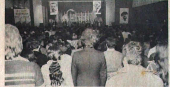
ESSEN'DEKİ ANMA TOPLANTISINDA 19'LER 15 KIZIL BAYRAKLA TEMSİL EDİLDİ.

gizli karanlık hükümeti iktidardadır. CIA'nın, MIT'nin, Amerikanın, demagog m. ile, ulus mangaları, mafiam, konter gerillam ile iktidardadır. Devlet dairelerine, okullara, iş yerlerine, ordu ve polis örgütüne yerleştirdiği kadro ile iktidardır. Eli kanlı demirel'ler, Türkçe'ler hükümetteyken ulamadaıkları uğursuz hedeflerine şimdi bu gizli iktidar aracılığıyla ulaşmak hesabı içindedirler. Demirel iğte bu karanlık güçlere dayanarak Başbakan Ecevit'i açıkça tehdit ediyor.