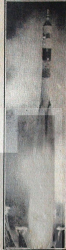
SALYUT 26 START SIRASINDA

Kanada'ya düşen ve zararlılığı yetkili makamlar tarafından da doğrulanmış bir dönesim başlangıcı oldu. Büyük tehlike gibi gösterme girişimleri de, artık çocukları bile kandırıyor. Hele bu başarıları gözelemediği hiç te beceremiyor.