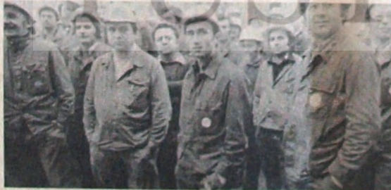
NORDRHEIN-WESTFALEN'DE BİNLERCE İŞÇİ UYARI GREVİ BİNASINDA