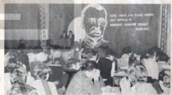
FRANKFURT'TAKİ ANMA TOPLANTISINDA YÜZLERCE İŞÇİ, ÖĞRENCİ VE AYDINIMIZ KATILDI

lerce kişi katıldı. İşçiler, komünistler, sosyal demokratlar, gençler, emeçli kadınlar, öğretmenler, öğrenciler, ilerici demokratik kişiler, binlerce yurtsever yurdun her köşesinde düzenlenen bu toplantılarda tek bir yunus, tek bir güreşçi gibi bir araya geldi. Burjuvazinin amansızca işlediği bu cinayete karşı kin ve öfkesini haykırdı. TKP'nin layıkla anılması, Mustafa Suphi'lerin yalınca, TKP'nin bu