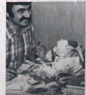
MADEN-İŞ'LE DAYANIŞMA KAMPANILARININ DA İŞÇİLERİMİZİN BAĞI YAKIŞINA ÖZ-NEMLİĞİNE faşizme, ilkesini bağını kulan HATÜ ÇEVRE gibi saldırılan örgütleri karşı-ya savagı hazırlanması, işçi kar-şısızlığının düşme ve örgütlenme ü-çürlüğünün sağlanması ve işçi ana-ruunun parlamentoda temsil edilme-si, özellikle de Ulusal Demokratik