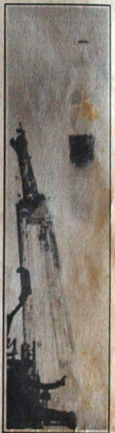
VE ARKADAN SALYUT 27 İZOLA ÇIKIYOR