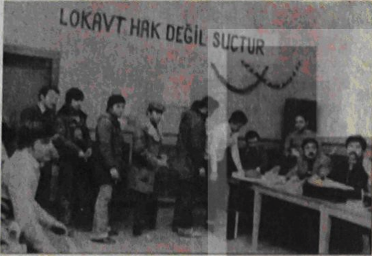
BATİBERLİN KİRE'E KARŞI MADEN-İŞ'İ DESTEKLEME KOMİTELERİNİN BAŞIN TOLAMTIRINA KATILAN KONFERANS BAĞIŞTA BULUNAN İÇİN KUYRUK OLANLARI