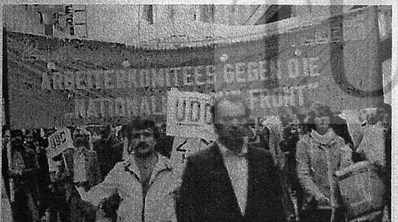
2.MC'YE DİRENİŞ KOMİTELERİ, İŞÇİLERİMİZİN YURT DIŞINDAKİ SAVAŞIMINI, ULKE-İMİZE GELİŞEN BAĞIMSIZLIK, BARIŞ VE DEMOKRASİ SAVAŞIMINA BAĞLAYAN EN UYGUN ÖRGÜTLENME BİÇİMLERİ OLARAK HIZLA GELİŞİYOR, ÇOĞALTIYOR.