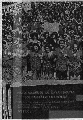
FİDEF'İN MADEN-İŞ'LE DAYANIŞMA KARTLARINI SATIŞ KAMPANYASINA KATILANLAR

Bunların tümü 1975 yılından beri Ulusalarama Para Fonu IMF'nin ön sürdüğü isteklerdir.Ve IMF yüzde 75 lik bir devalüasyon koşullarıyla bir likte bu istekleri dayatmak üzere 5 Eylül'de Türkiye'ye bir grup da mın yolluyor.Bunlar bir yandan MC hükümetlerinin bu güne kadar uyula dıkları yavaş ve yağma politikası nın yeterli olup olmadığını hakkında rapor tutacaklar,bir yandan da yuka rıda sıralanan istemlerin nasıl uy