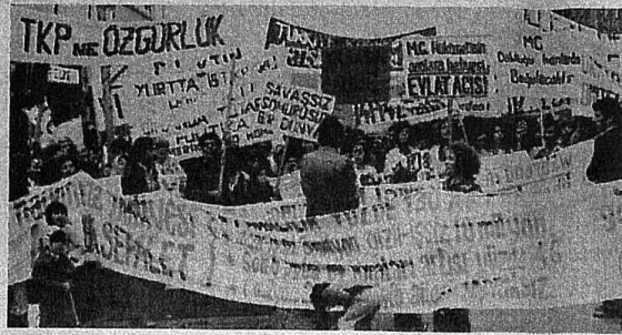
"2.MC'YE KARŞI BARIŞ VE DEMOKRASİ YÜRÜYÜŞÜ"NDE BİNLERCE İŞÇİMİZ ORTAK İSTEMLERİNİ VE SAVAŞ BELGİLERİNİ HAYKIRDILAR.