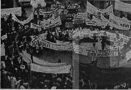
ESSEN'DEKİ YÜRÜYÜŞTEN SONRA BİNLERCE İŞÇİMİZ DEVRİM ANDI İÇTİ.