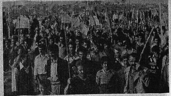
EMEKÇİ HALK,GEÇEKONDULARINI BÖYLE YİĞİNSAL BİR DİRENİME İLE SAVUNDU