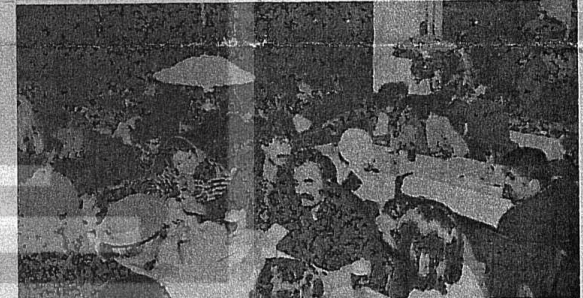
BATIBERLIN TUSAK GECESTİNDE "YAĞASIN DISK" BELGİSİ SIK SIK HAYKIRILDI

Yanıt: Şimdiden bildiğimiz bir şey var: çalışmalarımız seçimlere son bulmayacak.Biz işçiler gelişmeleri yakından izliyor ve sınıfın birliğini kayırdan değerlendireyoruz. Sorularımıza ancak hep birlikte mücadele verecek şekilde cevap verebileceğimizi de biliyoruz. Çalışmalarımız seçimlerden sonra da bu anlayış içinde devam edecek.