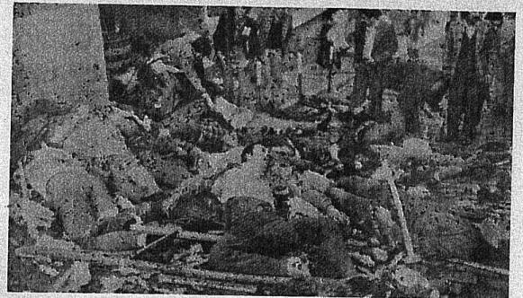
1 MAYIS ALANI'NDA MC'NİN KURŞUNLATTIĞI BİR İŞÇİLERİN KANI YERDE KALMAYACAK