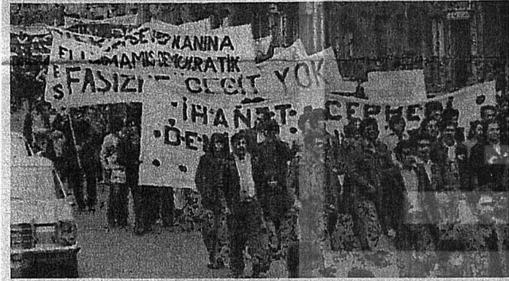
İŞÇİLERİMİZ, DEMOKRATİK TÜRKİYE İÇİN BATİBERLİN'DE DE HEP BİRLİKTE YÜRÜDÜ.

Batıberlin DİSK'le dayanışma ve seçimlerde CHP'yi destekleme yürüyüşünde işçilerimiz sokakları çınlattı!