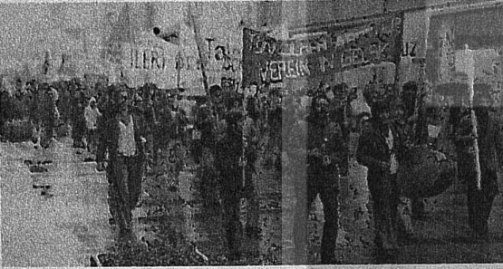
GELSENKIRCHEN'DE YAĞMURA RAĞMEN İŞÇİLERİMİZ ÇOŞKUN BİR YÜRÜYÜŞ YAPTI

TKP'nin tarihsel Konya Konferansı Platform Tezlerinden.