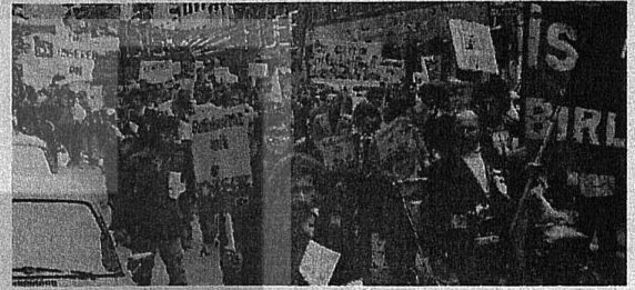
FİDEF'İN DÜSSELDORF'TA DÜZENLEDİĞİ "FAŞİZME KARŞI DEMOKRASİ" YÜRÜYÜŞÜNE FEDERAL ALMANYA'NIN HER YANINDAN 3 BİNDE FAZLA İŞÇİ KATILDI.