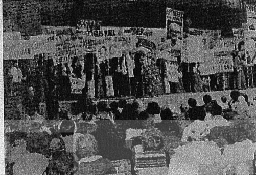
KOMÜNİST PARTİSİ'NİN SEÇİM TOPLANTILARINI EMEKÇİLER İĞİYLE İZLEDİ

Ancak hem Carter'ın, hem Ford'un büyük iç çevrelerinin aday olduğunu söylemek, Carter yönetiminin önceki yönetimlerden farklı olmayacağı anlamına gelmez. Carter'ın seçim son ram açıklanmasında da bu sezilmekteydi. Şunu israrla belirtmek gerekir: Carter, gözüm bekleyen büyük so-