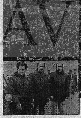
AMSTERDAM'DAKI YIGİNSAL GREVDEN BİR GÖRÜNÜŞÜ VE GREV GÖZCÜLÜĞÜ YAPAN UÇ İŞÇİMİZ

mekçileri işyeri garantisi için ve hayat pahalılığına karşı greve katıldılar.