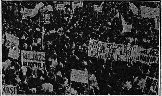
DİSK İŞÇİ SINIFININ VE DEMOKRATİK GÜÇLERİN ORTAK İSTEKLERİNİ KENDİSİNE SAVAŞ BELGİLERİ YAPMIŞTIR.141-142 VE KARŞI SAVAŞ BU BELGİLERİN BAŞINDA GELİR.