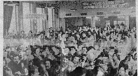
İŞÇİ KURULTAYI'NA KATILAN DELEGE VE KONUKLAR BİRLİK YOLUNDA ATILAN DEV ADIMI BÜYÜK COŞKUYLA ALKIŞLADILAR...