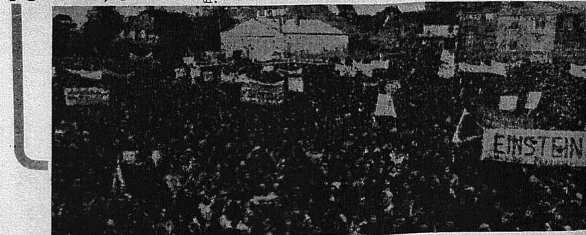
20 BİNEN FAZLA İNSAN KANSER YUVALARI, ATOM SANTRALLERİNE KARŞI BÜYÜK YÜRÜTÜŞ SIRASINDA