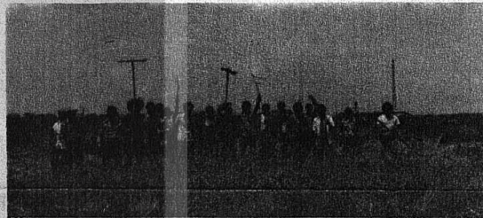
FEDERAL ALMANYA'DAN İDİR'DA KÖYNE İZİNE GİDEN BİR OKUYUCU- MUZ KURTULUŞ'U BERABERİNDE GÖTÜRÜDÜ. GAZETEYİ KÖYLÜLERİ İLE BİR LİKTE OKUDULAR. KÖYLÜLER BATTI AVRUPADAKİ İŞÇİLERİMİZİN BÖYLE GERÇEK BİR İŞÇİ GAZETESİNİ SÜREKLİ YAYINLAYABİLMELERİNDE GURUR DUYDULAR. ÇEKİRDİKLERİ RESİMLERİ YAYINLAMAK ÜZERE KURTULUŞ'A GÖNDERİLER. RESİMDE KÖYLÜLER, KİNDİRLERİNE YARDIM / GELEN İLERİCİ GENÇLERLE İMCEDE.

Sayın ATIF yayın organı, Bir yıldır gazetesini KURTULUŞ' a abone olmakla, sayılı olan bilgimi, sa- yenize biraz geliştirdim. Jerçi'de ha- ne öneleri de bu gazeteyi bulup oku- yabiliyorduk. İsten onun için abone- olmayı uygun bulmuştum. Şu yıl ister- di ki her vatandaş, her emekçi-ğitti bu gazeteyi okuyup aynı fikre sahip- olabilse, ama maalesef işçilerimiz, yan- bilerin temel eşitinden yok su- nularımızda çindir ki hala din- yobazlarının arkasında maalesef ko- şanımız oluyor. Çünkü benzinin o yıl- la yakanması, bir ilkokul mezunu bile- olmayan bir vatandaş, bir işçi bunun- akını yapsa yani ben ilericimiy, sö- mürye paydos diyebilse bu ilerici halk toplu için önemli bir gelişme- sayımlıdır. Baş şahsen Konya'nın Bozkır kazasının Üpşarı Mahiyesinde- benim mahiyemde ilkokul, orta- okul yapılabacağına konuşok 30 -dall- bir kütan kursu yapıldı. İşte bunlar MK Hükümetinin ve daha önceki çok- partili hayata geçeliden bir hükü-