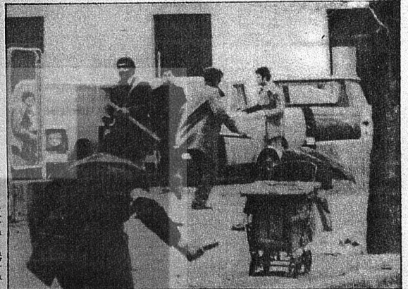
MACCU FAŞİSTLER ANKARA'DAKİ BÜYÜK YÜRÜYÜŞ VE MİTİNGE BİRKAÇ KEZ SALDIRILAR. FAKAT HER DEFASINDA PÜSKÜRTÜLDÜLER. MC'NİN ANKARA VALİSİNE HİZMETTE KUSUR ETMEDİLER