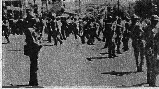
ELAZIĞ'DA İLERİCİ GÜÇLERE KARŞI GENEL BİR SALDIRIYA GEÇEN FAŞİSTLER, YER YER ASKERLERE DE SALDIRDILAR. FAKAT HALKATIN HAKKETTİKLERİ DERSİ ALDILAR.