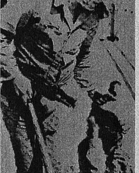
FALANJİSTLERİN ARAP HALKINA İHANET EDEREK İŞBİRLİĞİ ETTİKLERİ İSRAİL EMPERYALİZMİNİN İŞİNE BUDUR: BİR İSRAİL ASKERİ, BİR KIZI BARBARCA SAÇLARINDAN SÜRÜKLÜYOR.

Lübnan'daki işçi savaşına baş kapı tırcularından İsrail emperyalistleri, Lübnan'ın güneyindeki Ayn Ebel ve Ramayh köylerini işgal altında tutuyor. Üte yandan da bu bölgenin tüm imini işgal etmek için amma asker sel yığınlar yapıyor. Son olarak 22 tank, çok sayıda ağır topçu batır ve piyade birlikleri amir böl gesine nakledildi. ABD'ye yayınlanan "Time" dergisi, Filistin Halkını yönetmek isteyen falanjistlerin İsrail savagı bakanı Fe rez ile bir komplo kurduklarını ortaya çıkardı. Yapılan gizli anlaşma ya göre, ilericî güçlerin kontrolünde ki Sayda ve Tir limanlarını İra il'in abluka etmesi kararlaştırıldı. Üte yandan SBPK MK Organi Pravda gazetesi 8 Eylül sayısında Suri ye'nin Lübnan'a midahalesi eleştiril mekte ve şöyle denmektedir: "Şam, Lübnan'a asker göndermeye hangi diğün ceyle karar vermiş olursa olsun, bu karar Filistin Halk Hareketine kar şıdır ve sağcı güçlerin Filistin halkına ve ulusal yurtsever güçlere karşı bir darbe vurmanın kolaylaştır maktadır."