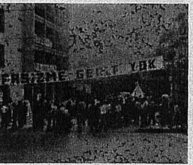
ANKARA'DA, ROMA OTELİ İŞÇİLERİ 17 TEMMUZDAN BERİ GREVDEN, İŞÇİLER E KONOMİK SAĞAŞIMLARININ POLİTİK SAĞAŞIMLA EL ELE YÜRÜYÜCEĞİNİ BELİR TİYORLAR. GREVİN MENEMER BELİSİ: FAŞİZE GEÇİRMEK İÇİN...