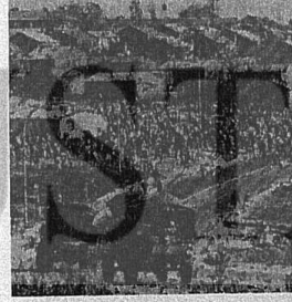
FAŞİST FORSTER'İN PANZERLERİ EMEKÇİ SİYAH HALKIN ÜZERİNE ÖLÜM KUSUYOR

Namibia'da Windhoek kentinde satın alınan kukla kabile temsilcileri ile yapılan toplantıda bu denemelerden biri, BM mandası altın da bulunan Namibia'nın 31 Ağustos 1976'da bağımsız olması gerekiyordu. BM'in bu yönde alması bir kararı da vardır. Ancak, ırkçı Forster'in seçtiği kukla temsilciler bu tarihi 31 Aralık 1978'e ertelediklerini açıkladılar. BM kararını çiğnediler. Namibia halkının gerçek temsilcisi SWAPO Kurtuluş Örgütü bu toplantıya katılmadı, ancak BM denetimi altında yapılacak bir görüşmeye katı-