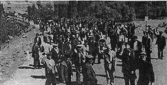
İşçi-köylü dayanışması Grevde bulunan Amasya maden işçilerinin gösteri yürüyüşüne emir köylülerden 1000 in üstünde pancar üreticisi köylü ile katıldı.