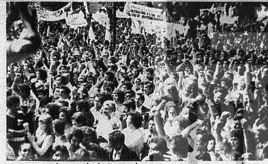
HOLLANDA'DA BİNLERCE İŞÇİ KÜLELEŞTİRME TASARISINI PROTESTO ETTİ

Hollanda'da işçilerimiz, 1 Mayıs'ı Hollanda Türküiyeli İşçiler Birliği'nin Rotterdam'da düzenlediği bir gecede kutladılar. Gecece, yurdumuzda ve dünyada 1 Mayıs'ın tarih çesini anlatıldı. Hollanda'daki işçilerinimizin somut sorunları açıklandı. 1 Mayıs istemleri dile getirildi. Nazım Hikmet'ten şiirler okundu. İTİB Folklor Ekibinin renklendirdiği gece, hep birlikte enternasyonal marşı söylenerek son buldu.