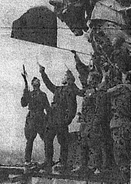
BERLİN'DE ZAFER KUTLANIYOR

Bu korkunç yıkıma karşın faşistleri yenilgiye uğratan da yine bu işçi Sovyet halkı oldu. Kur tarıcı Sovyet Kızıl Ordu Birlikleri Avrupa ülkelerindeki faşist zulme de son verdi. Avrupa halkları'nın da kurtarıcısı oldu. Bu medenileş, 31. yılını kutladığımız 8 Mayıs, halkların faşist zulümünden kurtuluşunun tarihidir. Bu tarih, aynı zamanda emperyalist savaşların açtığı yaraların korkunçluğunu, barışın ve tüm dünya halklarının dostluğunun gerekliliğini anlatır. Bu