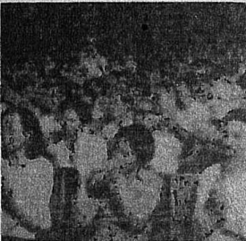
VIETNAM'DA 1 MAYIS YENİDEN BİRLEŞMENİN DE KUTLANDIĞI GÜN OLDU

Üsteki sosyalist ülkelerde de yüz binlerce emekçi sokaklara döküldü.