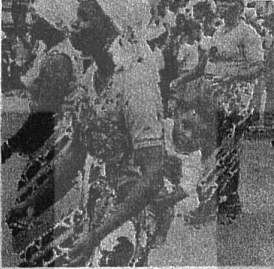
ANGOLA HALKI 1 MAYISLA BİRLİKTE KURTULUŞ UTKUSUNU DA KUTLADI

Portekiz'de 1 Mayıs stadyumunu dolduran yüz bin emekçinin "ünitede" birlik sesleri gökleri yığseldi, faşist saldırılar yerildi. İspanya'da yeniden yasaklanmasından rağmen, Barselona'da 3 bin kişi demokratik hakları için yürüdü. Madrid'de emekçilerle beraber yürüyüş gösteriler yapıldı.