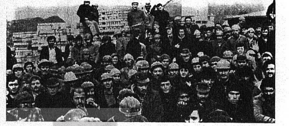
EREĞLİ DEMİR ÇELİK İŞÇİLERİ PATRONUN ZORBALIĞINA HAYIR DEDİLER!

kasında 6 aydır sürdürülen Toplu sözleşme görüşmeleri sonuç veremey ce,sendikadan aldığı karar gereğün ce işçiler greve bağlandı.DİSK'e ba lı Petrol Kimya-İş sendikasının grev kararına kargalk,patron da iş kavt ilan etti.Patronun bu yasa dı ğı tutumunu protesto eden işçiler "İsteklerimizi koparana kadar,grevi mizi sürdürüreceğiz.Patron bizi iş kavtla korkutamaz.Hiç bir baskı bizi yıldırılmaz.Sendikamızın yöneti minde mücadelemizi başarıya ulaştır acağız" dediler.