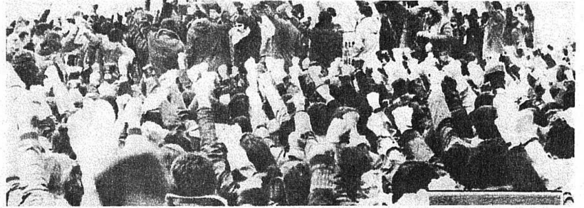
12 MART GÜNÜ ANKARA'DA YAPILAN DEV YÜRÜYÜŞTE İŞÇİLER VE GENÇLER FAŞİZME KARŞI ŞAHSANATA AND İÇİYORLAR

Birleşmiş Milletler İnsan Hakları Komisyonu, Uluslararası Af Teşkilatı, Dünya Barış Konseyi, Uluslararası Sosyal Demokrat Kadınlar Konseyi, Dünya Demokratik Kadınlar Federasyonu, Dünya Sendikalar Federasyonu, Uluslararası Hukukçular Komisyonu, Uluslararası İnsan Hakları Federasyonu gibi 102 kuruluş ve 24 hükümet temsilcisinin kabul ettikleri belgelerde şöyle denmektedir: "Batı Avrupa Hükümetleri ülkelerindeki neo-faşist ve ırkçı eğilimleri olan ve programlarında göçmen işçilere karşı saldırgan bir tutum benimseyen partilerin varlığına Devam 3.sayfada