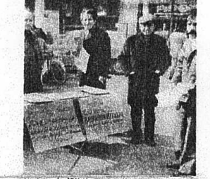
Federal Hükümetin "Zorbalık tasarı" na karşı, İşçilerin Komisyoununun tertiplediği eylem haftasında Alman ve yabancı işçiler yeni tasarruf ve haksızlığı protesto ediyor. Yukarıdaki resimde tasarrufu protesto et me için Nisseldorf şehrinin 3. ye rinde masalar kuran Türk, Yunan, ve Alman işçileri birlikte görülüyor.

Toplantıda konuşan Alman işçi örgütleri temsilcileri yabancı işçilerle el ele olduklarını bil dirdiler. "biz yabancıları yapı lanları haksız buluyoruz. Sizi desteklediğimiz gibi, çalışmaları nıza da katılmak istiyoruz" dedi- ler.