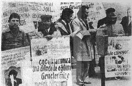
ARBEITSAMT ÖNÜNDEKİ BASIN TOPLANTISI

"Faşizm cinayetlerine karşı dev yürüyüş" katıldı. Dokuz kuruluş tarafından tertiplenen bu yürüyüş ve miting'te 20 binden fazla işçi, öğrenci, memur ve öğrenci iştirak etti. "Suntacılar istifa", "Faşizme nihayet, halkla bir hürriyet" belgilerini taşıyan, Tandoğan Meydanında yapılan mitingte, konuşmacılar harsız cephe ortaklarını protesto etmiş, fa Devamı 4.sayfada