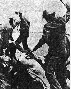
POLİSİN ZULMU İŞÇİLERİN DEMOKRASİ SAVAŞINI DURDURAMIYOR.