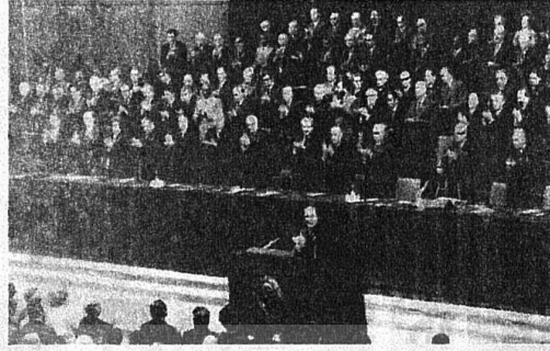
SOVYETLER BİRLİĞİ KOMÜNİST PARTİSİNİN 25. KONGRESİNİN BİR GÖRÜNÜŞÜ