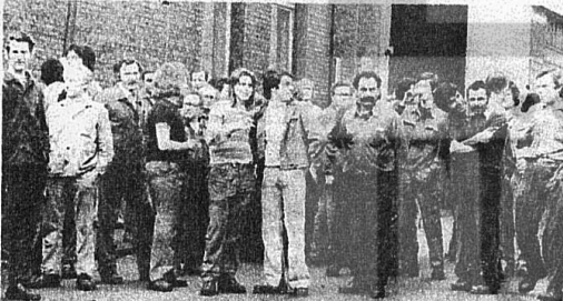
ALMAN, YABANCI 2000 İŞÇİ ESSEN-KRUPP'TA UTARI GREVİNDE

Açılan imza kampanyasının yanı sıra kent merkezinde halka bilgi verecek bir köşe kurulması, ilericiler ve Alman örgütlerinin bu eylemleri desteklemesini sağlamak, yapılacak çalışmalar arasında yer alıyor.