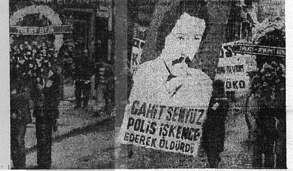
KAHPEDİ ÖLDÜRÜLEN GENÇLER İÇİN VERİLEN MÜCADELEYE ANALARIDA KATILİYOR meydanı faşistlere bırakmamızı talep edemez. Faşizme karşı mücadele duygusal değil, akılcı yol dur."