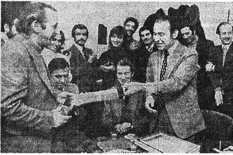
BELEDİYE BAŞKANI YENİ ÖRGÜTÜN AÇILIŞINI KUTLUYOR