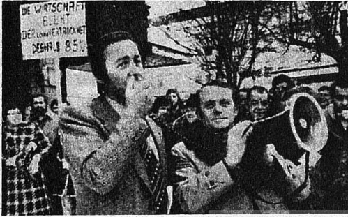
250 BİN METAL İŞÇİSİ UYARI GREVLERİ YAPTI. BU GREVLERE ÇOK SAYIDA İŞÇİMİZ DE KATILDI.