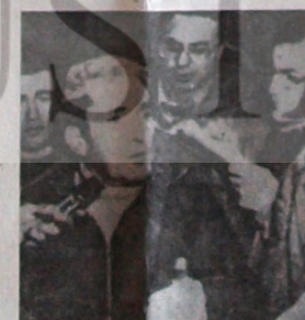
İSPANIYA'DA FAŞİZE KARŞI SAVAŞAN GENEL İLGİ KOMİTESİNİN ÜYELERİNİN ÇAMAÇI

Grevdeki ılgıçlılar, tutuklanan ılgıçlıların serbest bırakılmasını ve tek-