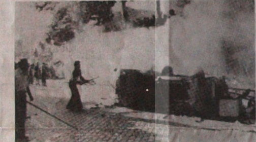
PORTEKİZ'DE GERİCİ GÜÇLER MAHALLE VE SOYAKLARA SALDIRILAR DÜZENLİYOR, YAKIP YIKIYORLAR, ESKİ FAŞİST DÜZENİ DİŞİLMEK İÇİN TERÖR UYGULUYORLAR.

Portekiz'de hükümet içinde sağa kayış gittikçe hızlanıyor. Son olarak Güvenlik Kuvvetleri başkanı general Carvalho da, kasım ayındaki olaylara katıldığı iddiasıyla tutuklandı. Buna karşılık, faşizm döneminin gizli polisi PIDE'nin ajanlarından 239'u daha serbest bırakıldı. Bu ajanlar CIA ajanları ile birlikte, özellikle ülkenin kuzeyinde