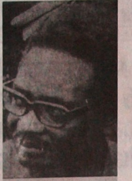
AGOSTINHO NETO MPLA ÖRGÜTÜ LİDERİ

Kıba halkının Angola halkına yaptığı yardımla ilgili bir basın toplantısı yapan başbakan Kantrio: "Çeşitli yollarla Angola'ya gönderilen Afrika birlikleri Angola'ya girmeden önce, Angola'da bir tek Kıba askeri yoktu. Ancak bu ılgıçlı asker gönderdik. Bu yardımın amacı, Angola'da sosyalizmin kurulmasını veya ekonomik çıkarlar sağlamak değil, espanyalizme karşı Kurtuluş Savaşı veren Angola Hal-