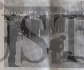
FAŞİST ASİLTÜRK FEDERAL ALMANYA'DA "İHAN AVI" KONUSUNDAKİ BİLGİSİNİ GELİŞTİRİYOR !

Hükümet bu silahlarla, Türkçe' in bugüne kadar "Güvenlik kuvvet lerine yardımcı olarak ilan etti gi emperyalistlerin uşarı faşist Ulku Ocaklarını resmi bir devlet teğkilatı haline getirerek donata caktır. Devam 3. sayfa