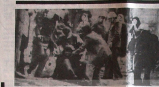
Topbaşında bir komando saldırısı karşısında, polisler suçluları tutukladılar. Komando serinden civardaki bir eve sığınan öğrencileri tabanca ve coplarla dışarı sürükleyip öldürdüler

nin ve onun yandaşı devrimci a kışların, köylülerin, aydınların, yurtsever aubay ve erlerin gücü nün artması, militarist generalle ri düşündürüyor. Öte yandan, sıkı yönetimi tek kurtuluş yolu ola rak gören İhanet Cephesi, saldırı lar, cinayetlerle buna sesin ha zırlanmaya çalışıyor.