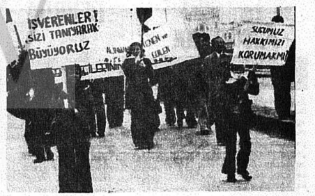
İSTANBUL VE ANKARA'DA SOSYAL SİGORTALAR KURUMU İŞÇİLERİ, İŞÇİ-MEMUR AYIRIMINA KARŞI AZİMLE DİRENİYORLAR