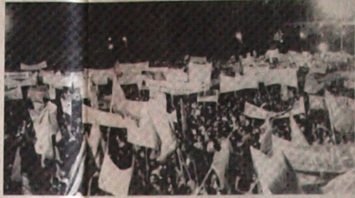
Silahlı Kuvvetler Hareketi ile halk arasındaki birliği, dayanışmayı göstermek amacıyla Komünist Partisi'nin yaptığı miting çalışmalarına on binlerce halk katıldı. Yukarıda bu yürüyüşte katılan halk görülüyor.

Üte yandan ülkede ekonomik dev rimler sürdürülüyor. 50 000 işçi ç n laştırılan en büyük firmalardan GUP devletleştirildi. Ayrıca başkent Lis bon 'da boş duran evlere el konu - rak işçi ve emekçilere konut ola - rak dağıtıldı.