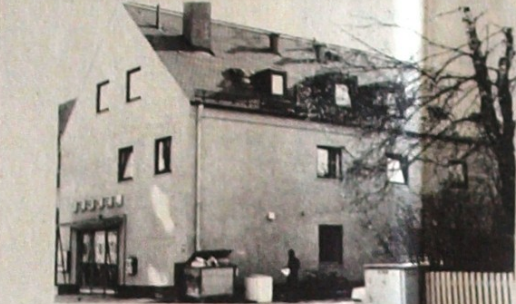
makina uğrayan işçiler, resimdeki hayızda kalmaktadır.

Stuttgart Türk Kadınlar Birliği, 11 Mayıs'ta anneler günü nedeniyle bir toplantı yaptı. Toplantıya, Birlik faaliyetinin yakılığında, Vietnam'da, Kamboya'da, Afrika ülkelerinde emperyalizme karşı kurtuluş savaşında hayatlarını kaybeden kadın genç hıtları anılmaları saygı duruşuyla, bağlandı. Daha sonra bu yığıt kadınlar ay birliğiyle yılın anası eğildi. Konuşmacılar yaptıkları konuşma larda kapitalist toplumda kadınların sorunlarını ele aldılar. Halkımızın verdiği ulusal bağımsızlık, sosyal kurtuluş ve ileri demokrasi mücadelesinde kadınlara da büyük görev düşüyor açıklandı. Kadınların kurtuluşunun işçi sınıfının kurtuluşundan ayrı olmadığı saptanarak, tüm kadınlara mücadelelerini alma, birlik ve dayanışma çağrısı yapıldı.