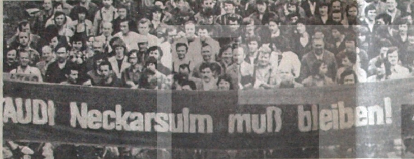
İŞÇİLER İŞTEN ATILMAYI, KİSA İŞ GÜNLERİ UYGULANMAYI, ÖRNEK PATRONLAR FIRKALARI KAPATILAN İŞÇİLERİN TÜMÜNÜ ORTADA BIRAKMAYI, BU HAKSİZLİKLA KARŞI YENİ, YANARCI TİP İŞÇİLER ÖZÜMÜZÜ, BİR BİRLİKTE PATRONLARA GEREKİN DERSİ VERMEKTE, HÜCADİSİ... MTL... EĞİTİM... R...

Federal Almanya'da kısa çalgımlar ve işten çıkartmalar devam ediyor. Patronlar işçileri işten daha kolay çıkarmaya her gün yeni bir çözümler buluyor. Bir devlet kurumu olan Arbeitsamt'lar da bu iş için emirlerinde kullanıyorlar. Böylece patronlar işçileri işten attıklarında Betriebsratlara (işçeri işçi temsilciliği) basıp vermekten iş mahkemeleriyle uğraşmaktan kurtuluyorlar. Bildiğimiz gibi, işçeri işçi temsilcisi, bir işçiyi çıkartıldığında; ne sebeple çıkarıldığını sorarak, işten çıkarmaya itiraz etmek hakkına sahiptir.