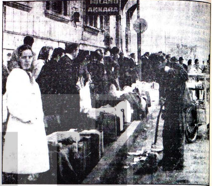
Almanya'dan izimli gelenlerle, çalışmak üzere ilk defa Almanya'ya giden Türk işçilerinden bir grup, kendilerini Almanya'ya götürecek otobüsün hareket saatini bekliyorlar. Çöpeği de hem yolu süpürüyor, hem de yolcularla sohbet ediyor.

Kardeşlerim, Burada çok önemli bir noktaya dikkat edelim; benim patronum olan bir şahıs nasıl benim menfaatime olan kanunu çıkarır? Bu olacak şey değil. Çünkü o zaman patron kendi menfaatini çişnemiş olur. Onun hedefi çalıştırdığı işçiyi sömürmek, milyonları kazanmak, sayfiyelerde, yatılarda ve Avrupanın çeşitli yerlerinde