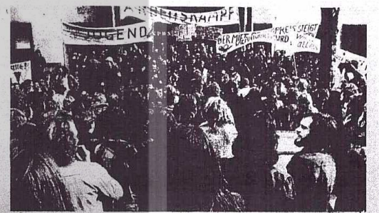
Geçtiğimiz hafta Federal Almanyada ve Batı Berlinde yapılan grevlerde Türkiye'li işçilerde uluslararası dayanışma anlayışı içinde aktif olarak katıldılar ve mücadele ettiler.

Toplantının sonunda toplantıya katılanlar Türkiye'de genel af konusunu ele aldılar. Fikir açılışını eylem suçlusu ayırımı yapılmaması, tüm 12 mart tutuklularının serbest bırakılması, 141, 142, 146. maddeler gibi faşist kanunların kaldırılması, Tutuklulara siyasi haklarının iadesi istendi. Bu konuda Türkiye'ye bir telgraf çekilmesine karar verildi.