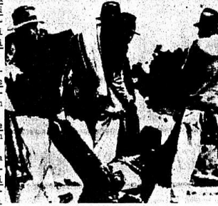
Boliviya'da savağan köylüler

Geniş halk kitlelerinin reel gelirlerini ciddi bir derecede küçülttüren devaluasyon neticesinde kullanılan enflasyon gelişmesi 1972 senesi sonunda % 400'e ulaşmış, et, şeker, un, yağ gibi ana gıda maddeleri fiyatlarının yüzde yüz artmasına yol açtı.