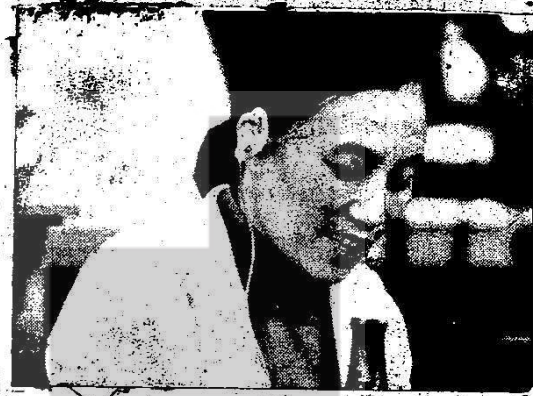
Güney Vietnam Dışişleri Bakanı Bayan N.T. BINH

Temmuz ayı başında Mısır'ın Demokratik Alman Cumhuriyetini tanıması (Doğu Almanya), Batı Alman dış politikasını büyük bir şekilde etkilemiştir. Daha önceleri Sudan, Yemen, Irak, Suriye gibi arap devletleri Demokratik Alman Cumhuriyetini tanımışlardı. Bilindiği gibi Batı Almanyanın İsraili tanınmasıyla arap ülkeleri Batı Almanya'yla diplomatik ilişkilerini kesmişlerdi. Batı Almanya'nın İsraille büyük maddi yardımlar yapması, arapları öldürmeleri için silah satması, ve İsrail-arap harbinde araplar aleyhinde dünya kamu oyuna propaganda yapması, arap ülkeleriyle Batı Almanya'nın münasebetlerinin kötüleşmesinin başlıca nedenleridir.