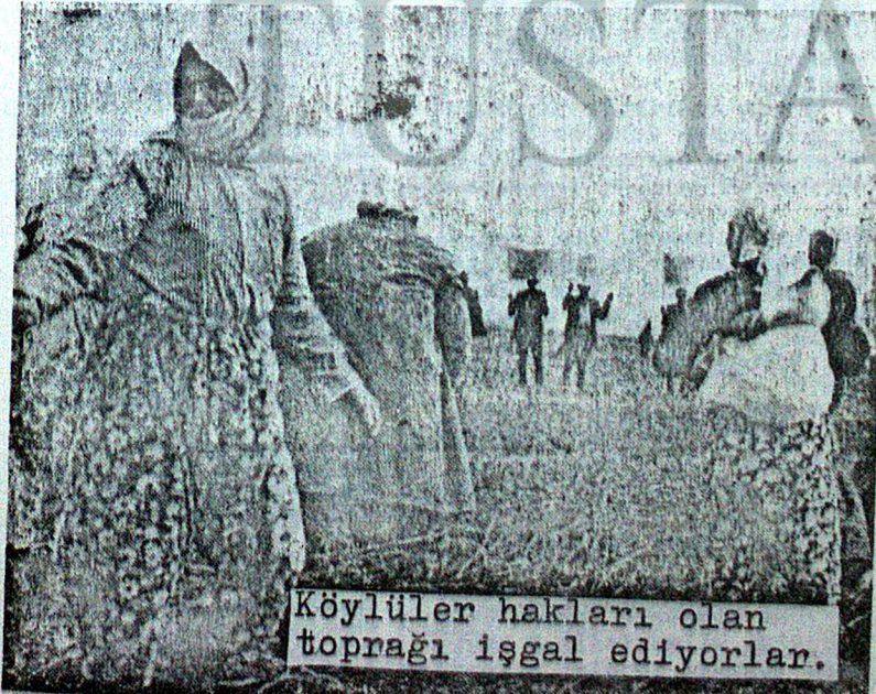
Köylüler hakları olan toprağı işgal ediyorlar.

Ve ellerinde kazma, kürek, yaba, 800 köylü topraklara yürüyordu. Yıllar yılı üzerinde yaşayıp bir türlü sahip olama- dıkları, köle gibi çalıştırıldık- ları topraklara... Devletin o- lup da ağaların kendilerine malettikleri topraklara... Sömürücü partilere, işçileri bakanına, kaymakama, ağalara, jandarmaya rağmen yürüdüleri! Çünkü canlarına tak demmişti haksızlık. Canlarına tak demmişti ırgatlık!