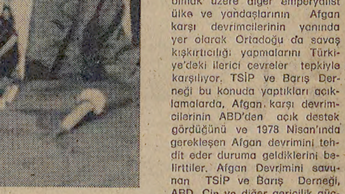
Haber Merkezi - Barış ABD olmak üzere diğer emperyalist ülke ve yandaşlarının Afganistan devriminin yanında yer alarak Ortadoğu'da savaş karşıtlığı yollarını Türkiye'de ileri taşıyor