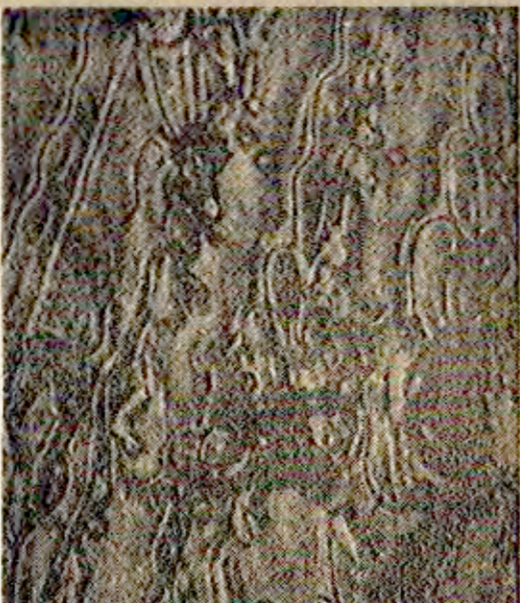
Soğutulan mikroskop altında -160 derecede alıyularının durumu.

Profesörün, olayın hikayesini anlatmaya başladığı ve kanın dondurulması için rastlantı olduğunu belirtti. Ayrıca bu tür sudur olaylarının ilk örneği olduğunu, ABD yetkililerinin güvene verilmeye kararlı olduğunu belirtti.