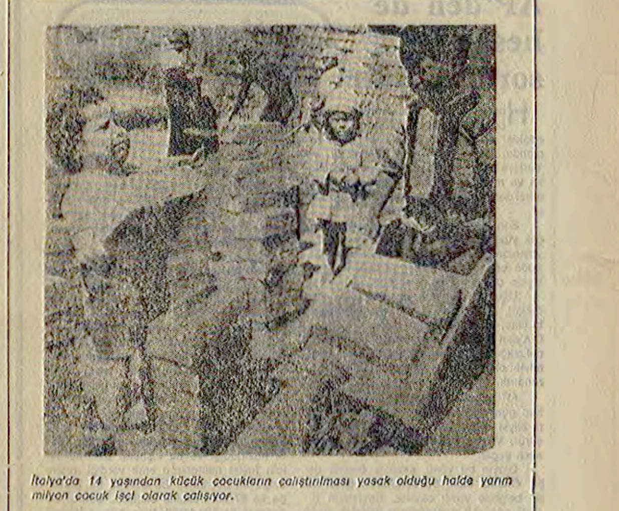
İtalya'da 14 yaşından küçük çocukların çalıştırılması yasak olduğu halde yarımlar milyon çocuk işçi olarak çalışıyor.