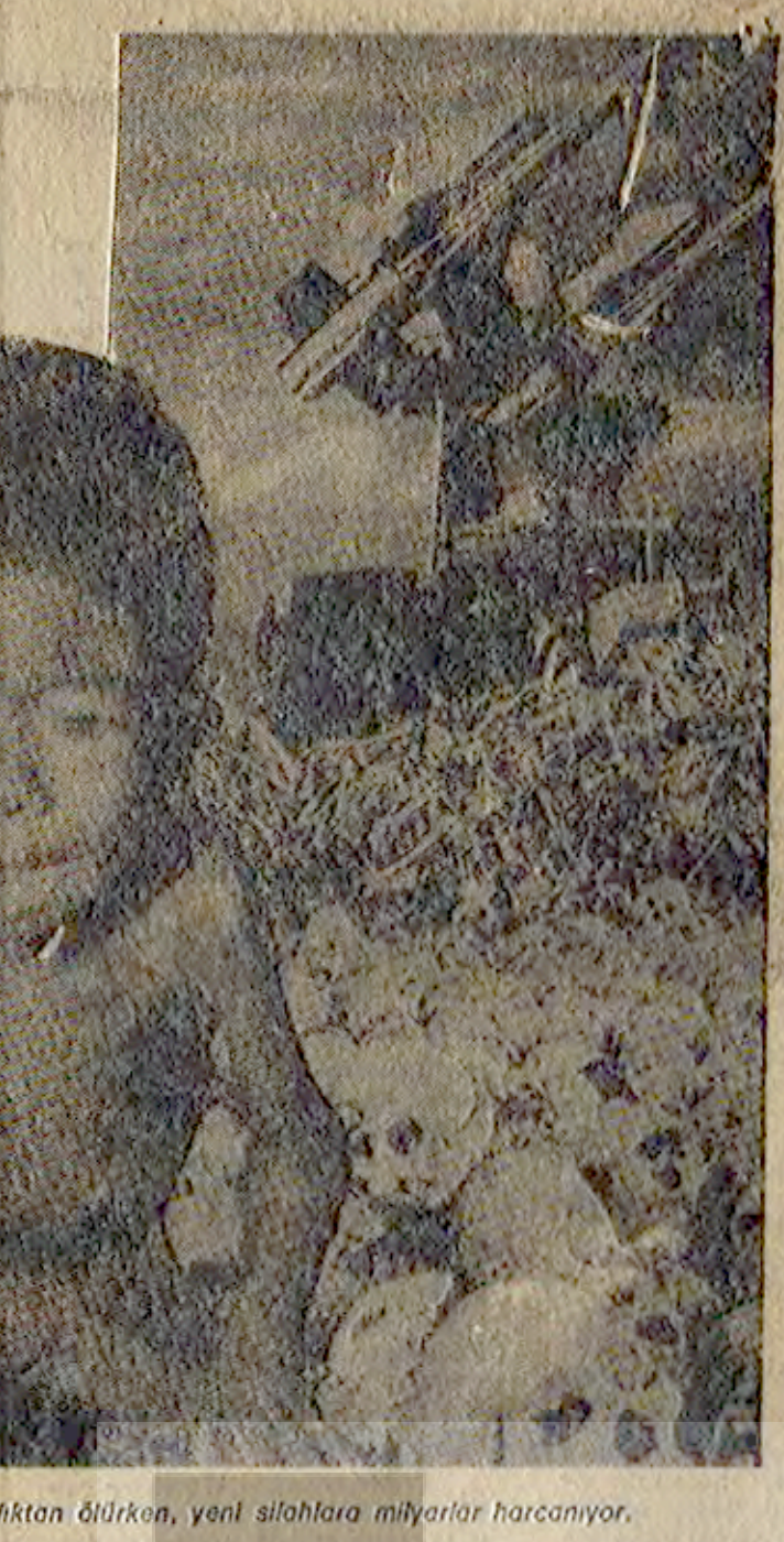
Her yıl milyonlarca çocuk asketten dönüyor, yeni silahlara milyonlarca harcıyor.