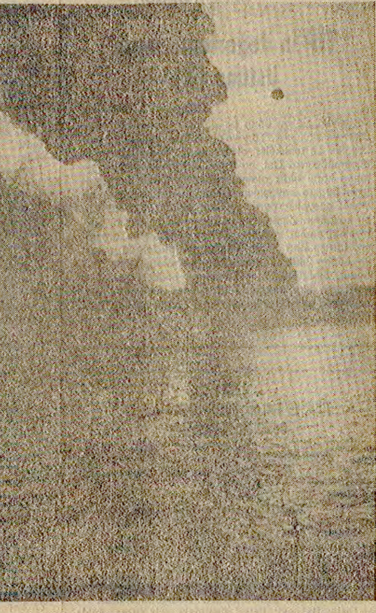
Yakıt dolu Romen tankeri İtalya ile Yunan şilebinin çarpışmasıyla birlikte Romen tankeri infilak etti ve yanmaya başladı. Dumandar tüm İstanbul semalarını kapladı.

Meteoroloji yetkilileri İstanbul'da lodos Fırınası tehlikesinin sözkonusu olduğunu böyle bir durumda da Kadıköy ve Moda'nın sahil kesimlerinin yanma tehlikesiyle karşı karşıya kalacağını bildirdiler