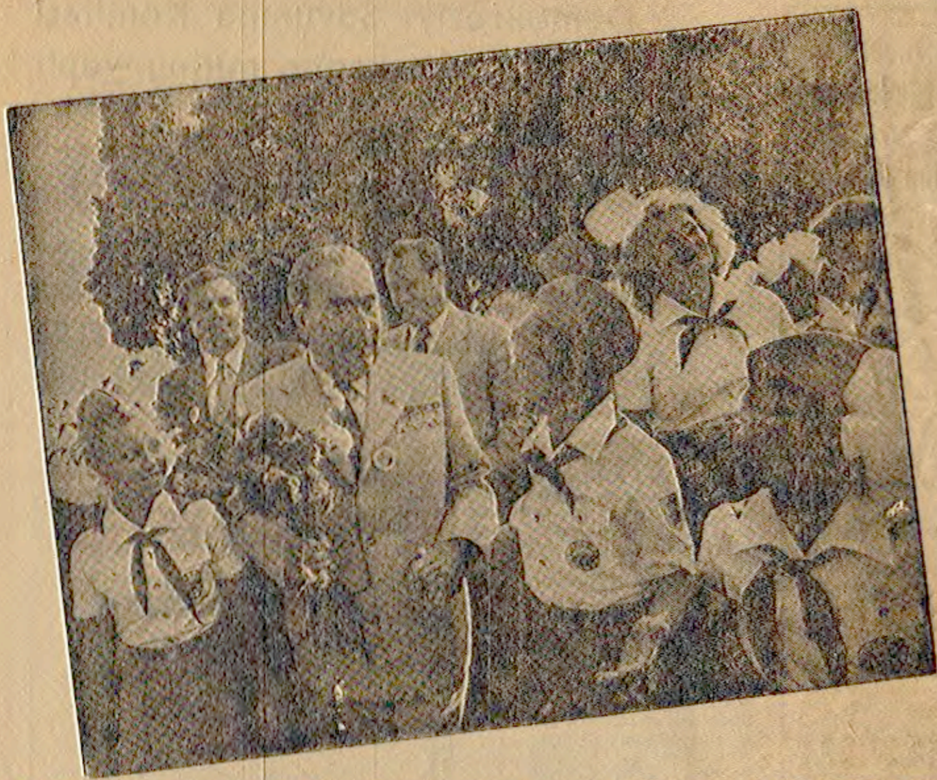
SBKP MK Genel Sekreteri, SSCB Yüksek Sovyet Prezidyumu Başkanı L. I. Brejnev'in, V. I. Lenin bütünü öke «Artak» piyoner kampını ziyaret