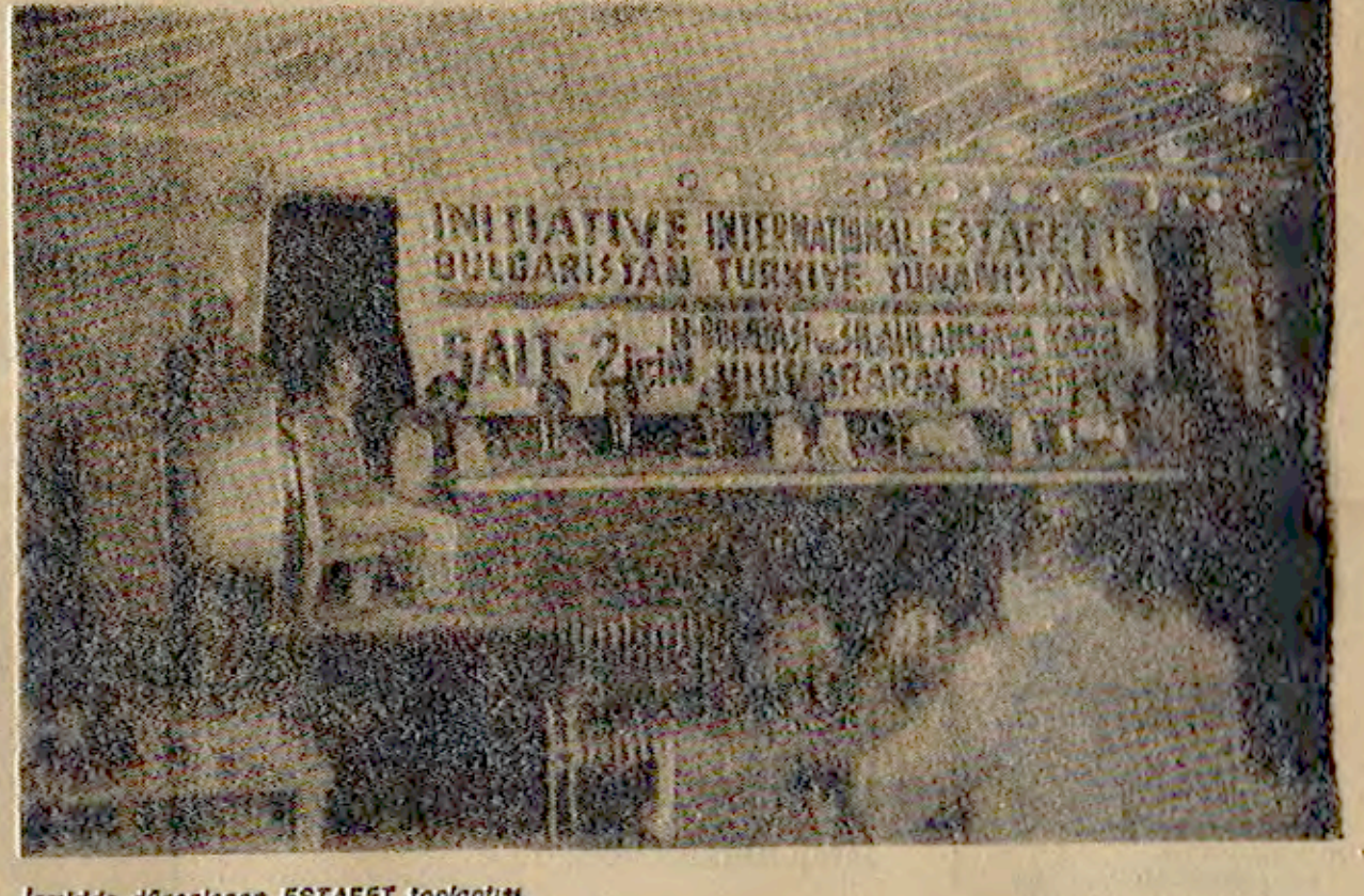
İzmir'de düzenlenen ESTAFET toplantısı.