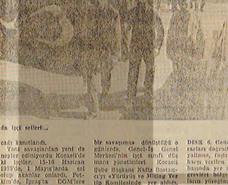
İşçi yatağı İmit sokaklarında işçiler...