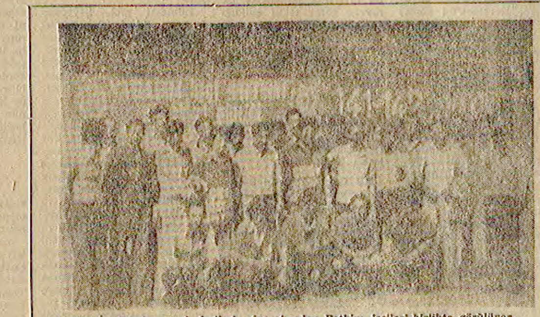
İleriçi-İş üyesi grevci işçileri ziyaret eden Petkim işçileri birlikte görülüyor.

Federal Almanya'nın Göppingen kentinde demokratik kurumsal öneldiğinde antifaşist bir gösteri yapıldı.