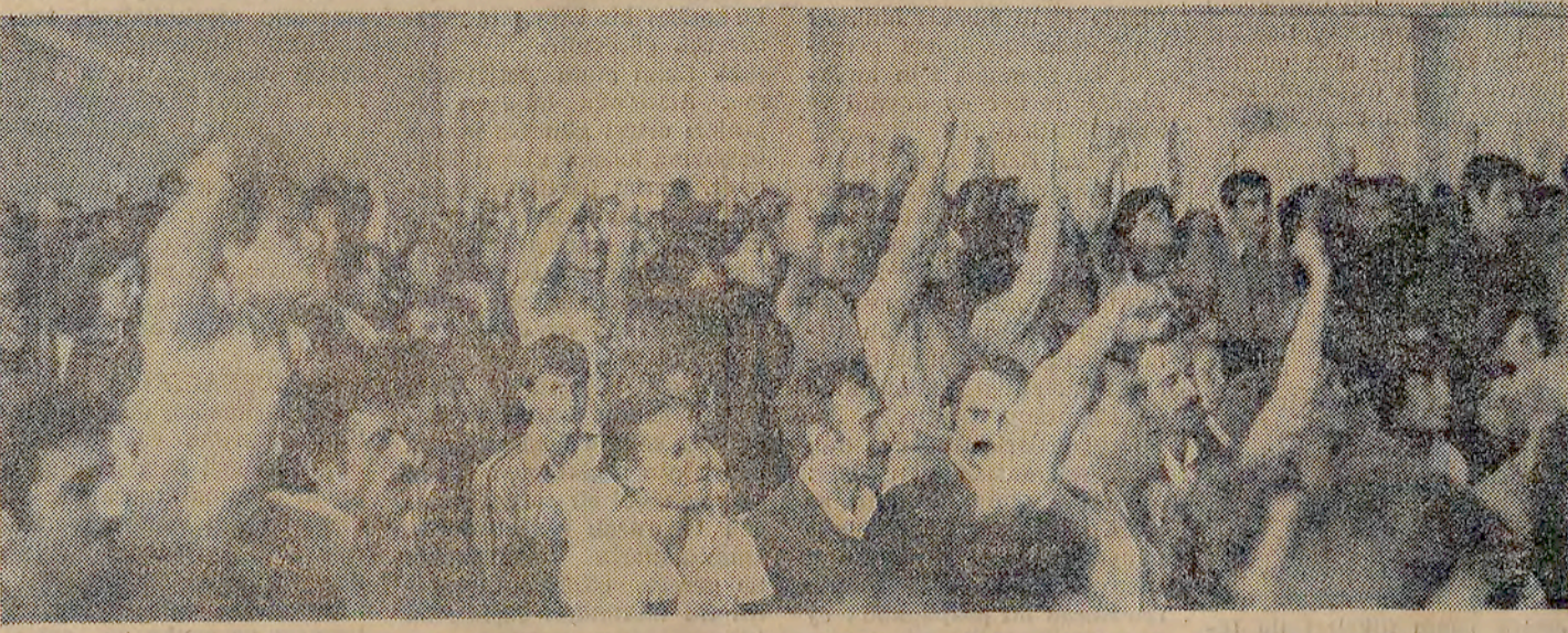
Alibeyköy'deki eylem birliği toplantısında «yaşam eylem birliği, «faşizme geçit yok» sloganları atıldı.