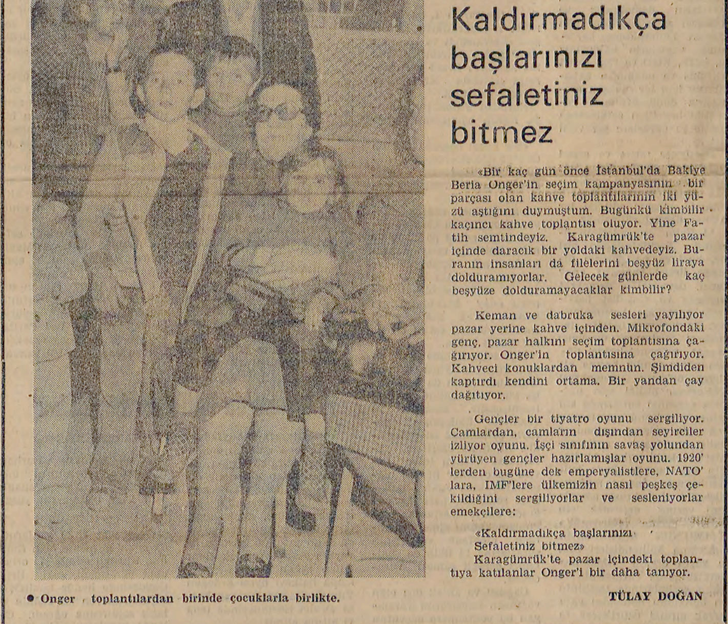
Öngör - toplantılardan birinde konuşurlarına dikkat.

«Eylem birliği, faşizme geçit yok» sloganlarıyla keşildi. «Yaşam eylem birliği, faşizme geçit yok» sloganlarını atarak kahve toplantısı yapıldı.