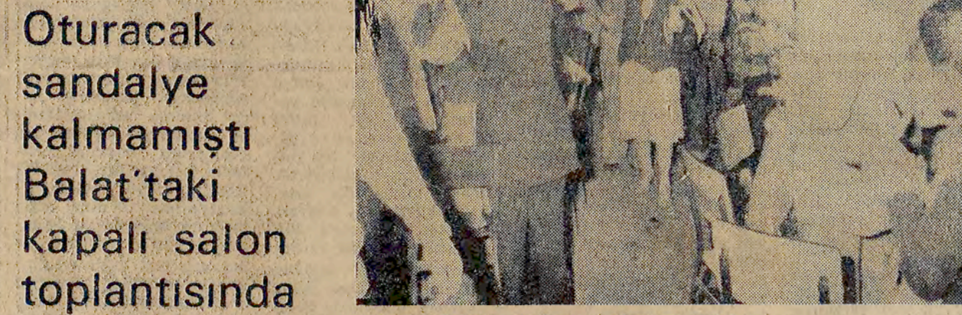
Ongor, Balat'ta toplantı salonuna girerken.

Başbakan İzzet Ecevit, radyo ve televizyonda yaptığı konuşmada, "MHP'nin faktörleri konusunda elimizde kanıtlar var."