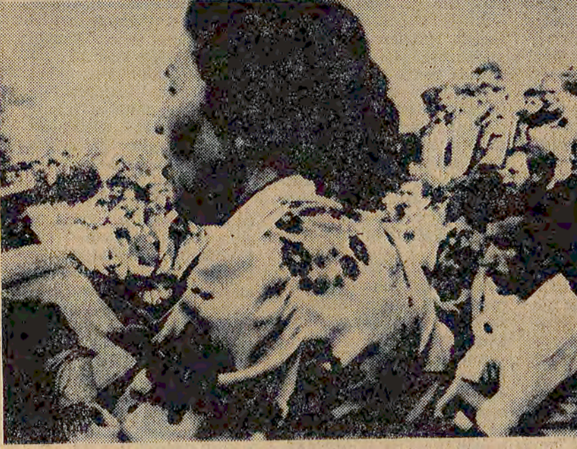
Zeytinburnu toplantısında Nafiz Bostancı Ecevit'e soruyor: