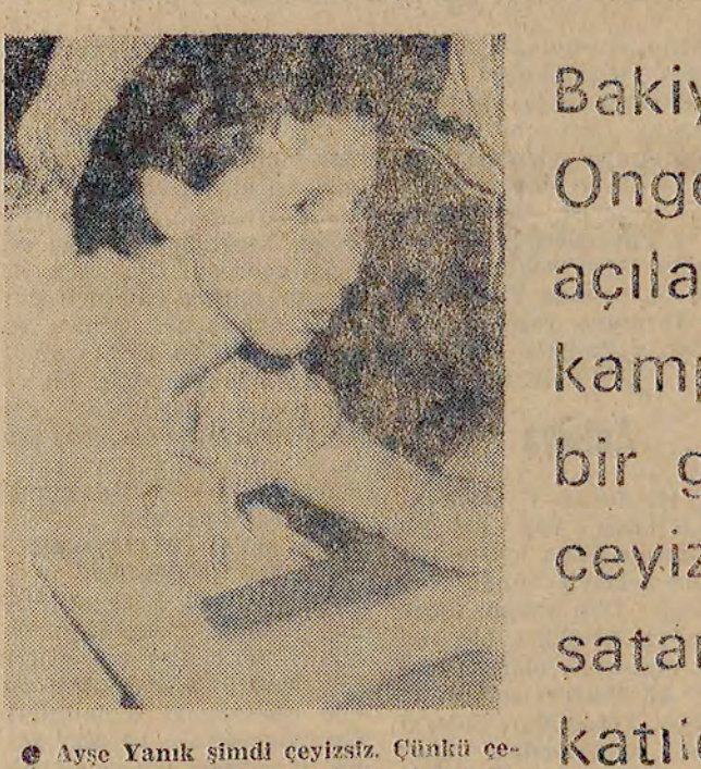
Bakiye Beria Onger için açılan kampanyaya bir genç kız ceyizini satarak katıldı

Zonguldak (İSTANBUL) - Zonguldak'ta yayımlanan Üçüncü Gazetesi, Bakiye Beria Onger'in seçim kampanyasını genişlettiğini bildirdi. Politika'da yayınlanan kampanyaya da katılan Üçüncü Gazetesi sahibi Ali Danış, konuşma yaptığı sırada şöyle dedi: «Geçmiş seçimlerde olduğu gibi, bu seçimde de ilgisiz siyasetçi olarak değil, halkın yararına çalışarak aday oluyorum».