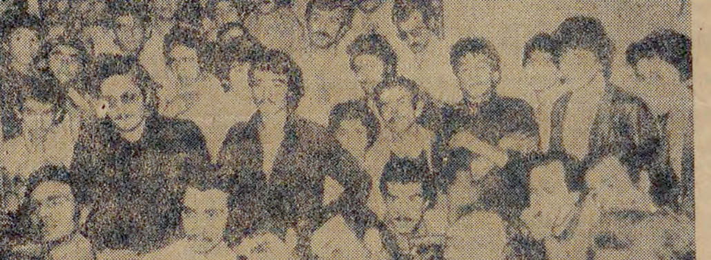
«Eoovit'le çalışmaya başladığımız» diyor, Hayır, oyları bölünmüyor. Sadece seni kendine getiriyorsun»

«Ama benim, benim, benim...» diye başlayan konuşması, Onger'in baskınları sırasında yaptığı konuşmaları hatırlattı.