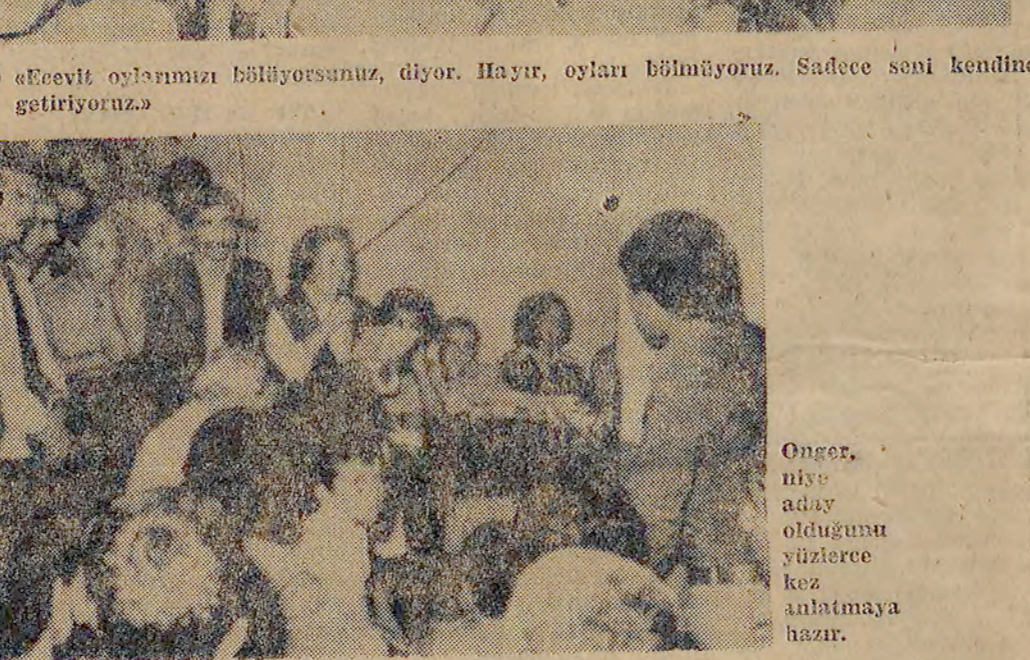
Onger, niye aday olduğunu soruyor. «Kendimden değilim» diyor