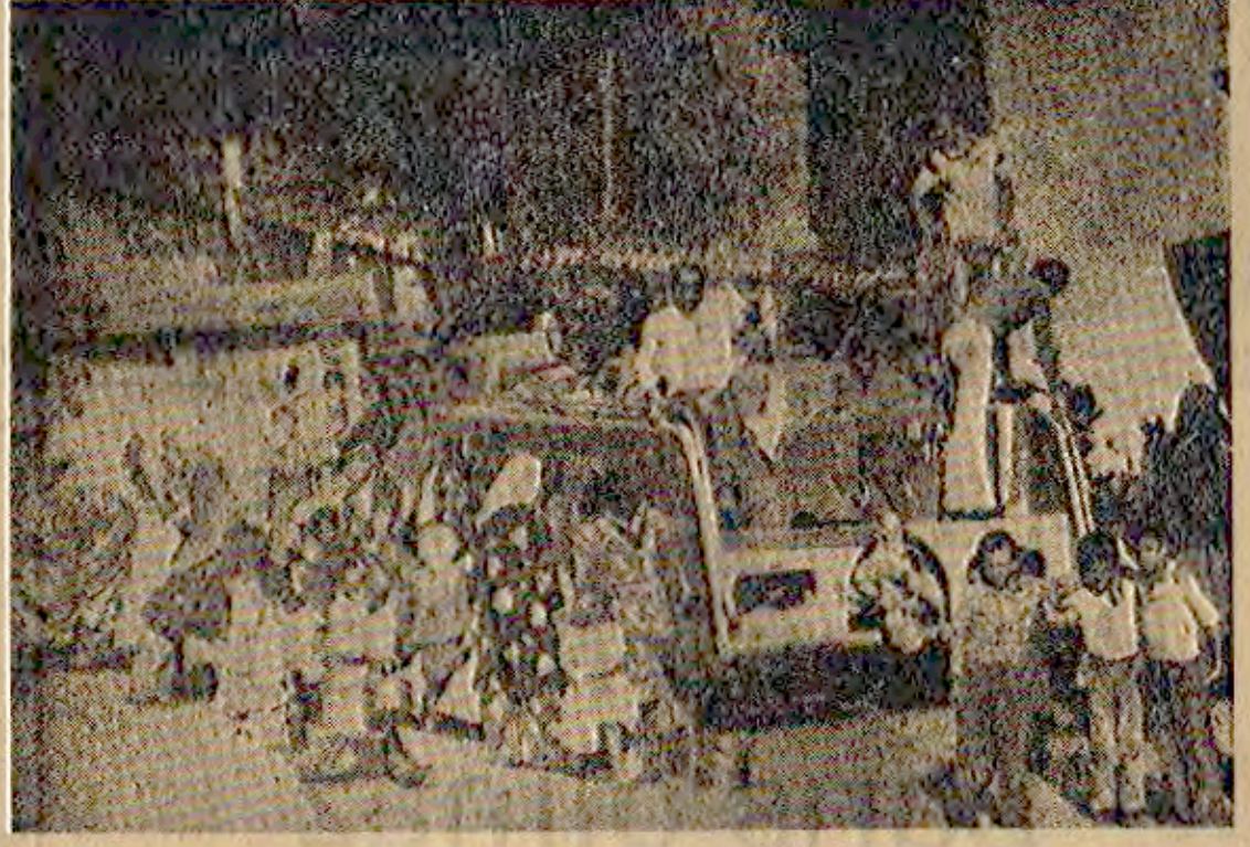
Çerkes Belediyetinin gönderdiği araçla deniz suyu alan Afur köylüleri.