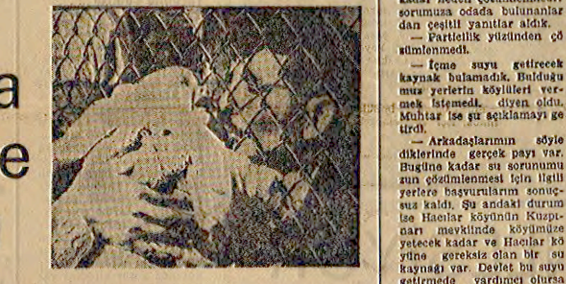
Çocukları el öperek arasından geçmeye çalışılan Uruguaylı baba.