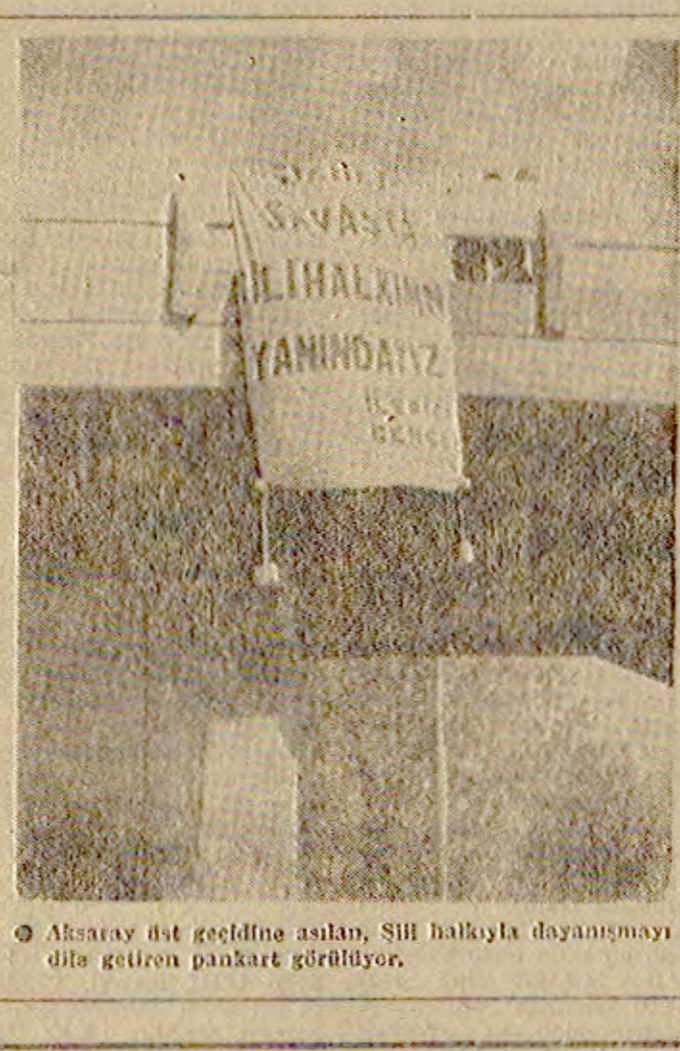
Aktaray üst geçidine asılan Şili halkıyla dayanışmayı dile getiren pankartın yakın çekimi