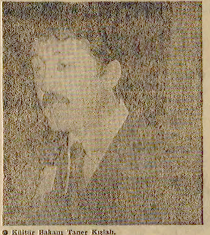
Kültür Bakanı Taner Kışlalı.

«Polis vazife ve selahiyetleri yasasının 6. maddesi yürürlüğe kaldırıldı» sanstür sorunu kesin bir çözüme bağlanamaz»