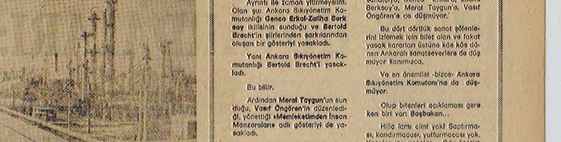
Burada, 48Knyönetim Komutanlığının yasalarını aldığı yer...

1979'da Türkiye'de on yıllardır yarılanın girer yarılanmaktadır.