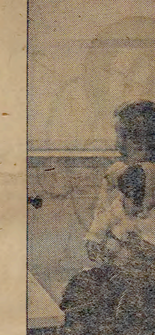
Bir anne, 23 yaşında genç bir anne. Birbuçuk yaşında yavrusunu göremeyen hıçkırıklarla göz yaşlarında diler.

"Eh, ne oldu?" diye soruyorum. "Eh, ne oldu?" diye soruyorum. "Eh, ne oldu?" diye soruyorum. "Eh, ne oldu?" diye soruyorum. "Eh, ne oldu?" diye soruyorum.