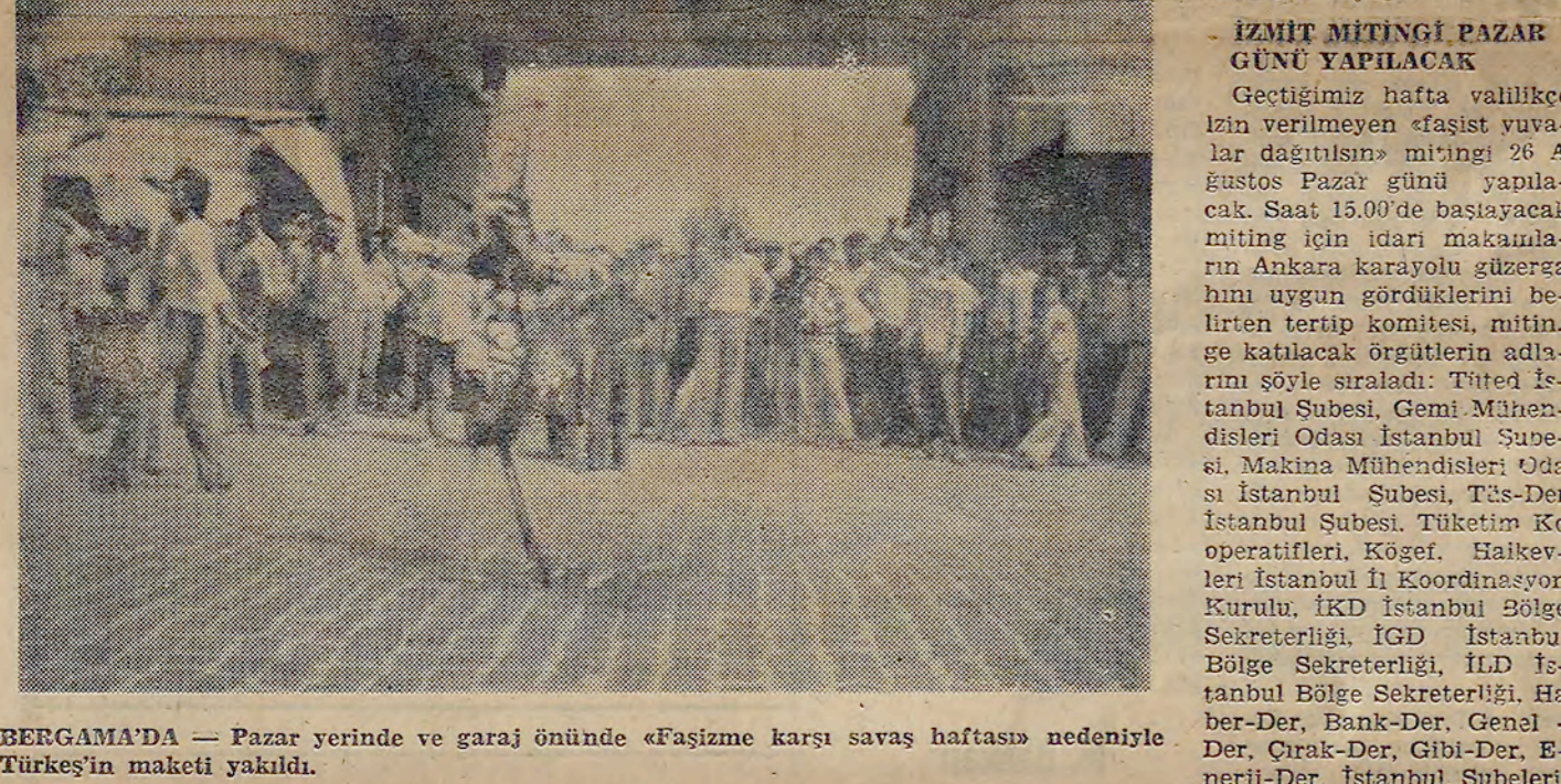
BERGAMADA — Pazar yerinde ve garaj önünde «Faşizme karşı savaş haftası» nedeniyle BERGAMA'da yazıldığı.