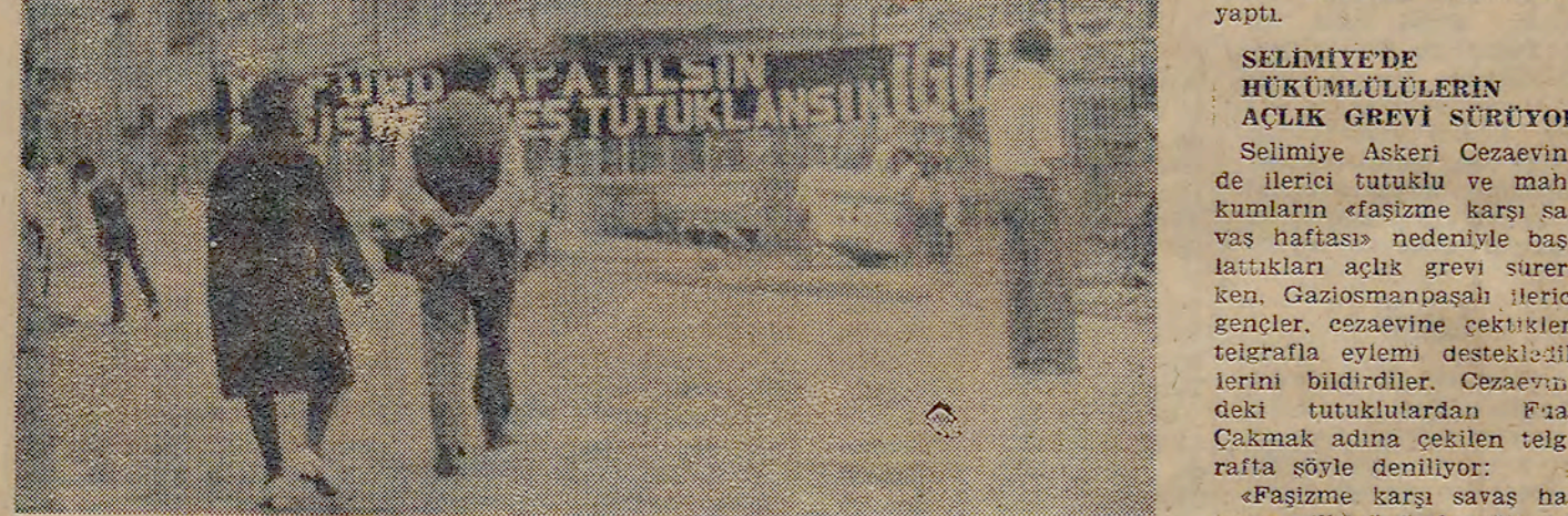
RAYNAMESASIDA — Dün ve önceki gün İstanbul'da çeşitli gösterilerin yanı sıra Bayram paşada da İleriye Gençler Demokrasî Caddesini keserek yola bir pankart astılar. Pankartın bir süre asılı kaldı.