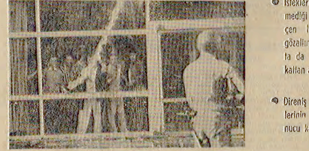
Sabahın erken saatlerinde başlayan işgali askerî birlikler önce su sıkarak kırarak istedikler...