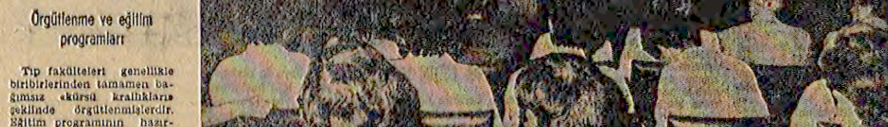
Türk Tabipler Birliğinin 28. Genel Kurulunu, sağlık hizmeti erişileli için pek çok konunun tartışıldığı bir forum özelliğinde...