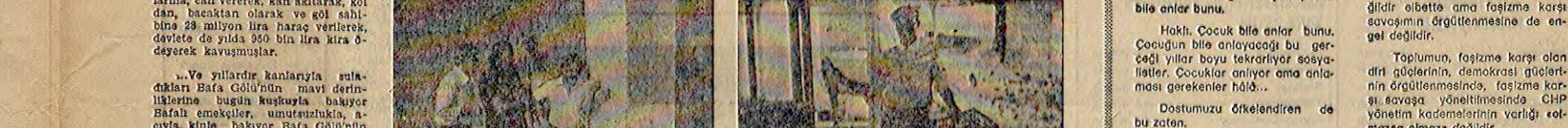
Bafalı emekçiler tekne yokluğunda balığa çıkmadıkça, saksit/tahtıkten balıkları koruyamadıkları için ucu-puhalık kim olursa satsınca ve bok tavuk için arca gerederler...