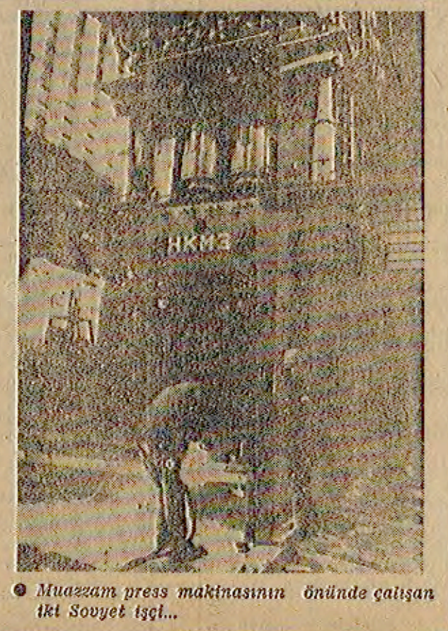
Muazzam press makinasının önünde çalışan iki Sovyet işçisi.

Fransa (ABC) — Fransa Devlet Başkanı Valéry Giscard d'Estaing'in son Moskova gezisinden bir yana, iki ülke arasındaki ekonomik işbirliğinin yeni olanaklarını geliştirmekte olduğu bildiriliyor. Örneğin, Fransa'nın İsmi göbeğinde İsove'da iki ünkün teknik işçileri ile kurulan press fabrikasında ABD ve Sovyetler Birliğindeki banzerleri ile rahatlıkla rekabet edebilecek kapasitede olduğu ifade ediliyor. Birkaç ay önce iki parti arasındaki press anlaşmalarının özellikle uçakların dokümanlarında verimli olduğu belirtiliyor. Press fabrikasında yaklaşık 100 Sovyet işçisinin çalıştığı öğrenildi. İsove kentinde bulunan alıy verişe çıkan Sovyet işçi alımlarının hemen alışığı, bütün bayramlarını ez bere biletiği haber veriliyor.