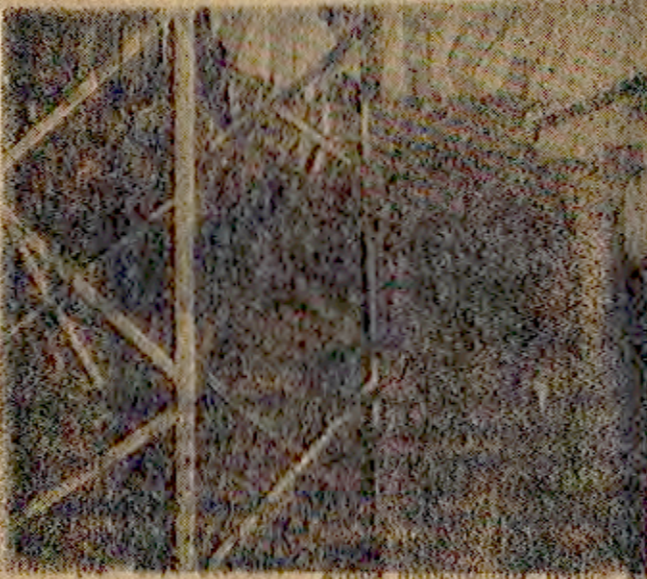
Emet'in Yağlık köyüne elektrik vererek cadrlarına denince kurban kesiliyor.